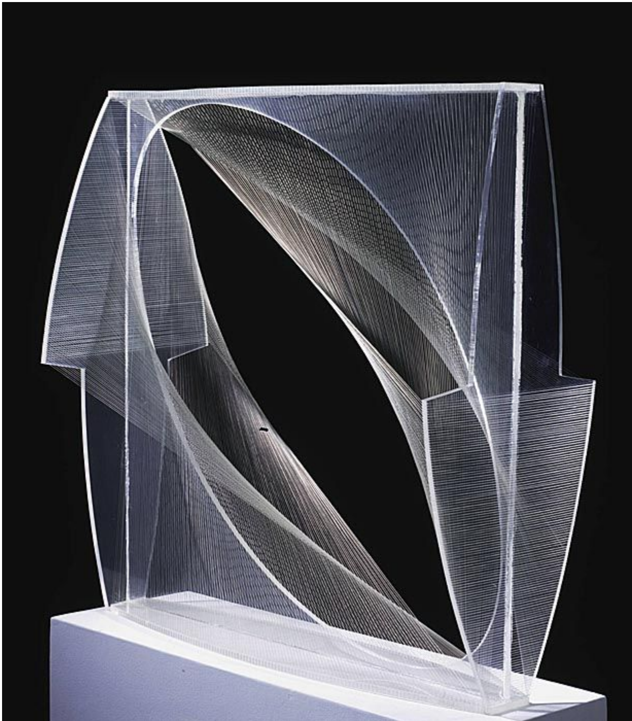
Naum Gabo Linear Construction No. 1 sculpture Acrylic and nylon 1942-3 object: 349 x 349 x 89 mm