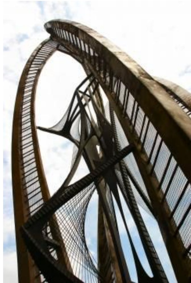
The stylized flower from Naum Gabo Naum Gabo 1957 concrete, marble, steel and bronze Rotterdam centre. 26 x 45 x 54 m