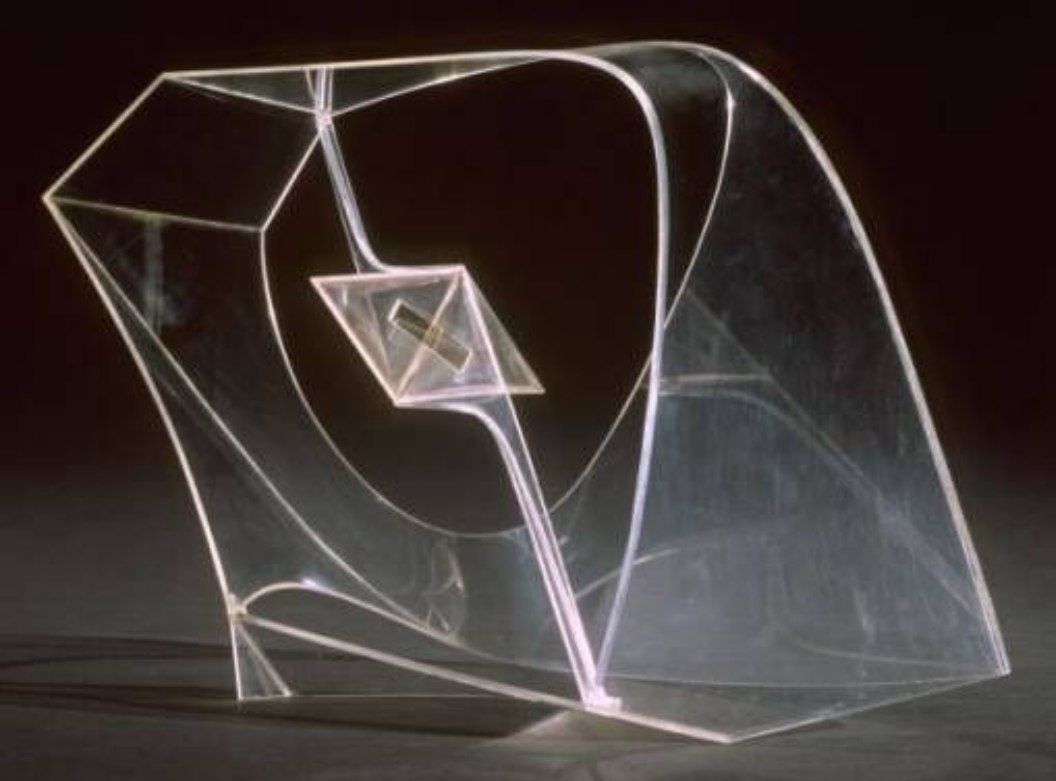
Construction in Space with Crystalline Centre 1938-40