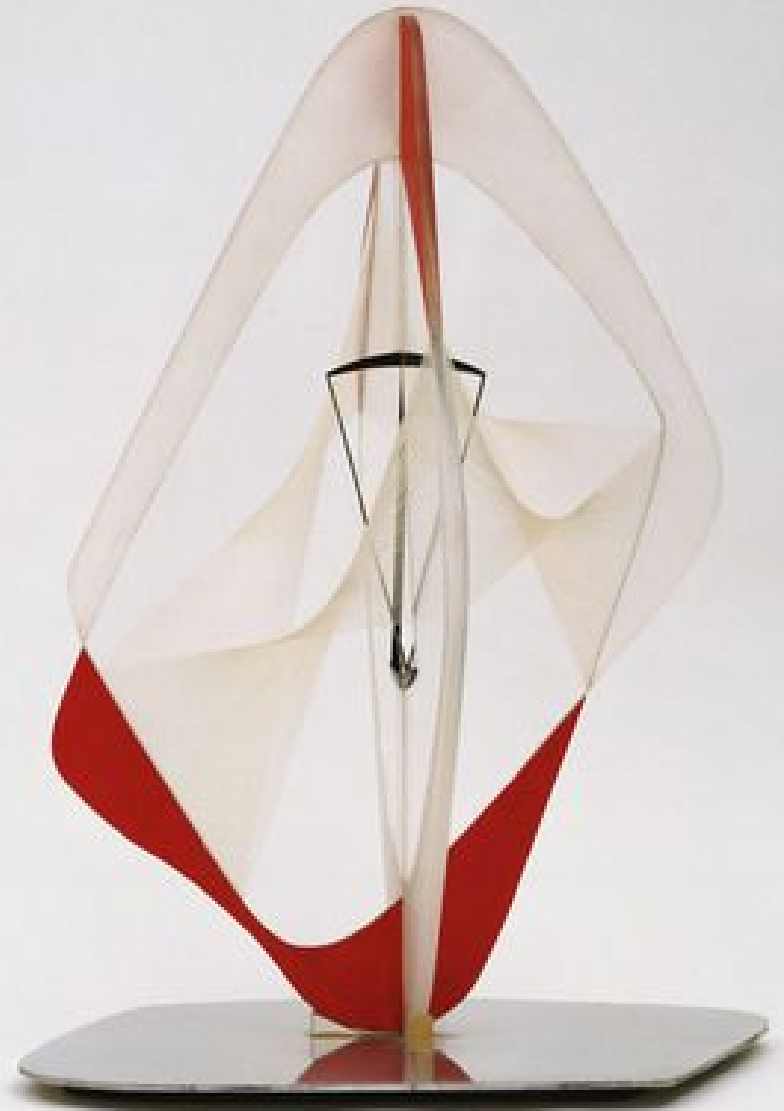
Naum Gabo Linear Construction in Space no. 3, with Red 1952-53. Plexiglass and nylon wire, with aluminum base, 73 x 46.4 x 47.3 cm; base, 2.3 x 33.6 x 55.2 cm. Nelson A. Rockefeller Bequest