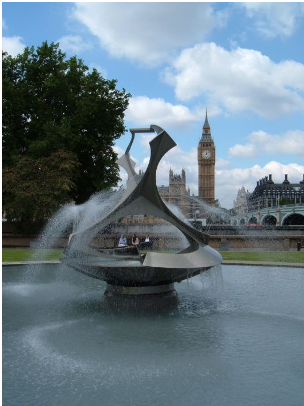
Sculpture/fountain by Naum Gabo at Guy's and St Thomas's Hospital, London, U.K.