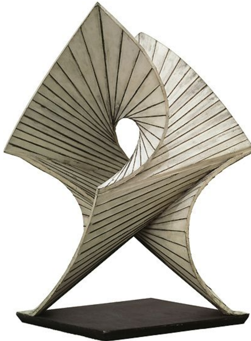
Antoine Pevsner Developable Surface 1938–August 1939 Bronze and copper, 52.1 x 31 cm, including base

Peggy Guggenheim Collection, Venice 76.2553 PG 61 © Antoine Pevsner, by SIAE 2008