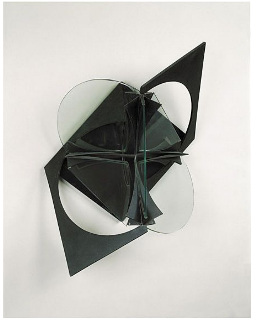
Marble, brass painted black, .1933 , Anchored Cross and crystal, Length, Overall, (Diagonal): 33 5/16 inches; Marble Base: 15 3/16 x 13 5/16 inches; Height, Semicircular Crystal Sheets: 9 15/16 inches; Height, Triangular Crystal Sheets: 5 9/16 inches.

Peggy Guggenheim Collection. 76.2553.60. Antoine Pevsner © 2007 .Artists Rights Society (ARS), New York/ADAGP, Paris