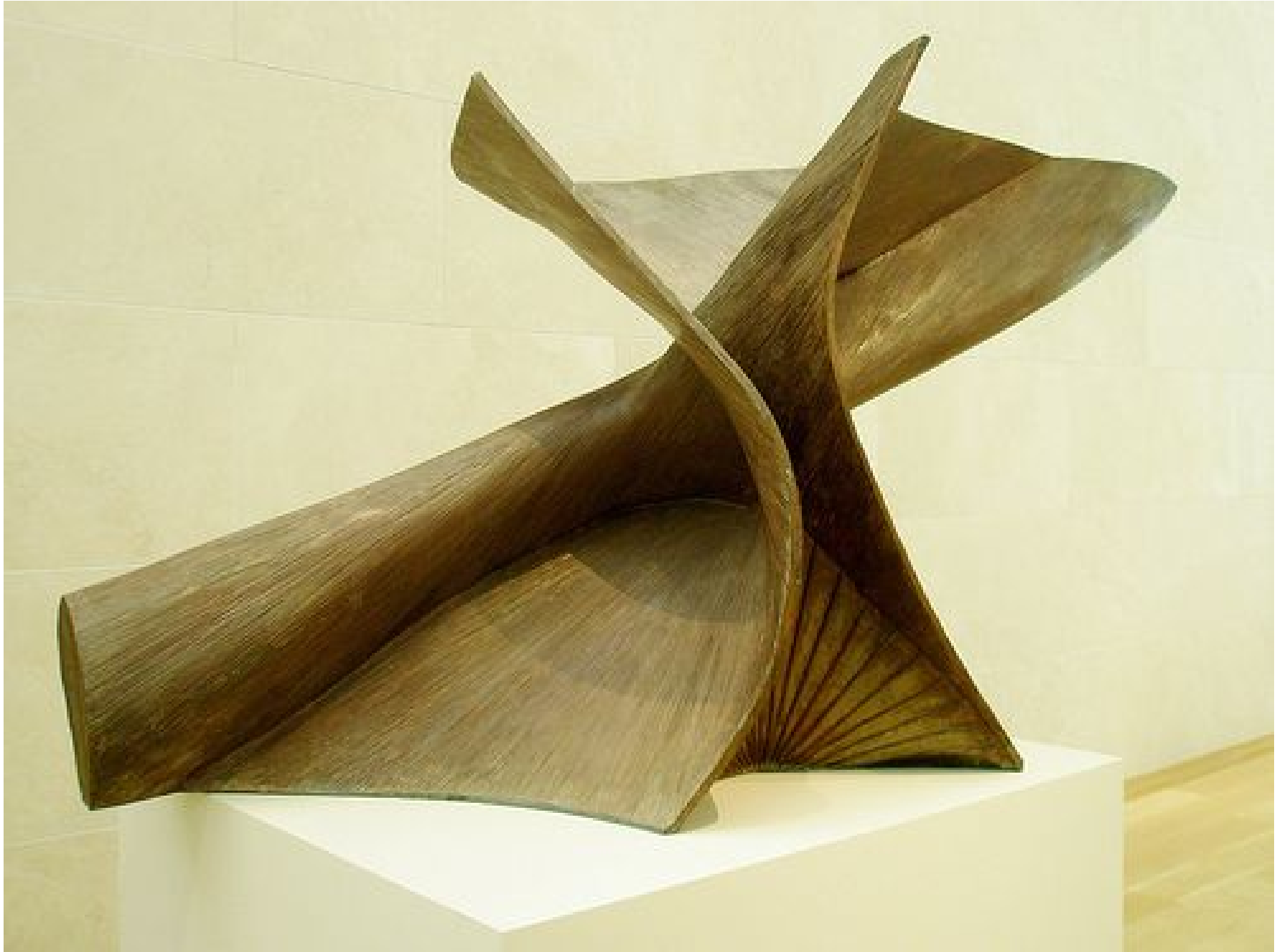
Antoine Pevsner 'Dynamic Projection at Thirty Degrees', 1951-52,