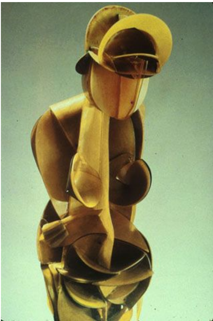
c. 1925 , Torso :Antoine Pevsner •