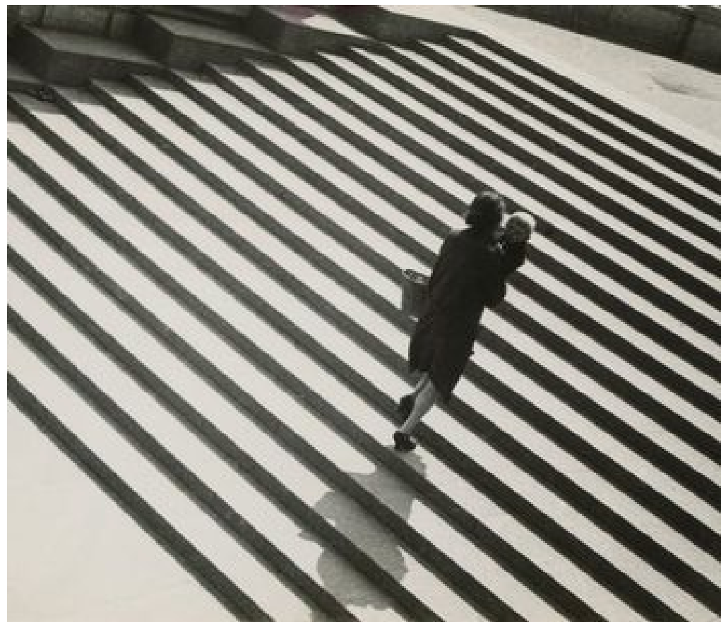
Alexander Rodchenko. Stairway 1930.