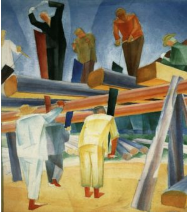
© .Bogomazov - Sawyers • National Art Museum of Ukraine