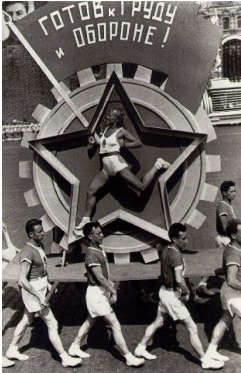
Alexander Rodchenko The live badge 1936