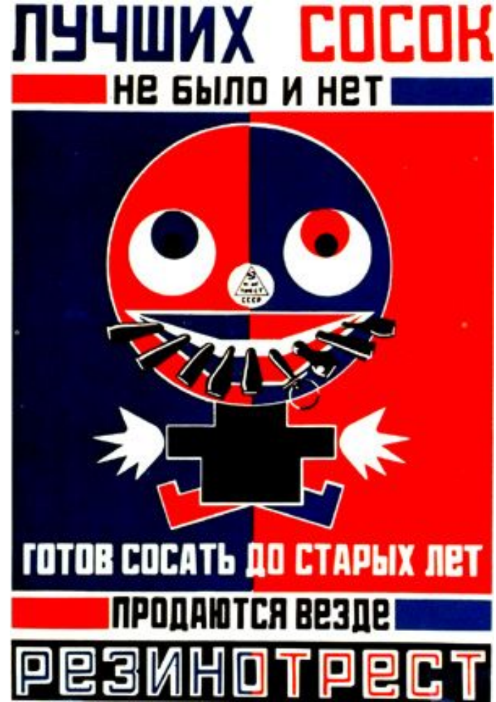
The Best Nipple, 1923 • Alexander Rodchenko and • Vladimir Mayakovsky