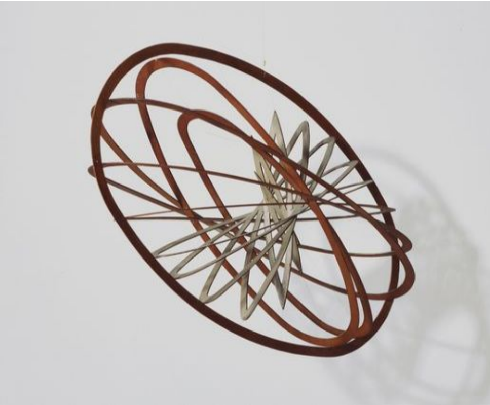
Spatial Construction .(Aleksandr Rodchenko. Russian, 1891-1956 • Construction c.1920

Plywood, open construction partially painted with . no. 12 aluminum paint, and wire, (61 x 83.7 x 47 cm).