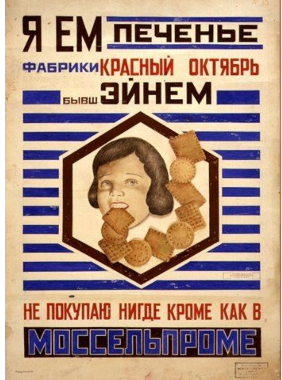
Maquette for an advertisement for cookies from the Krasnyi Oktiabr' (Red October) factory. 1923. Text by Vladimir Mayakovsky. Gouache on paper, 81.3 x 55.2 cm. Howard Schicker Fine Art, New York