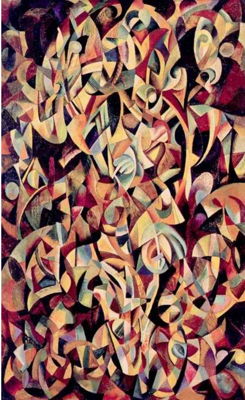
Alexander Rodchenko Dance . An Objectless Composition , 1915