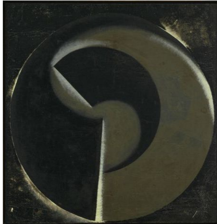
.(Aleksandr Rodchenko. (Russian, 1891-1956 .1918 . Non-Objective Painting no. 80 Black on Black Oil on canvas 81.9 x 79.4 cm.