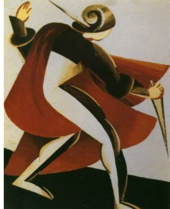
Exter - Figure, © National Art Museum of Ukraine