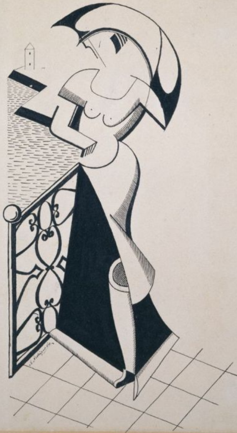
Alexander Archipenko (Woman with Umbrella, CA. 1916-1919 Pen & ink on paperboard 27.1 X 21.2 cm . Hirshhorn Museum