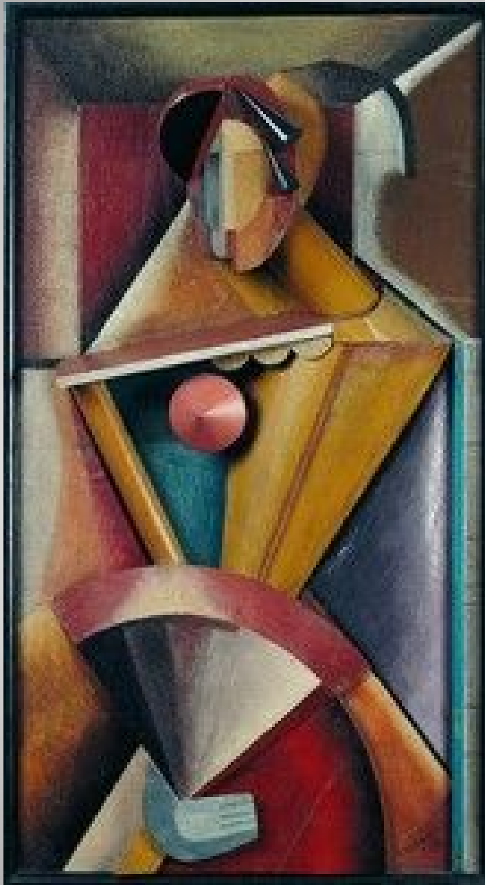
(1887-1964) Alexander Archipenko Woman with a Fan 1914 Wood, sheet metal, glass bottle and metal funnel 108 X 61.5 X 13.5 cm Tel-Aviv museum