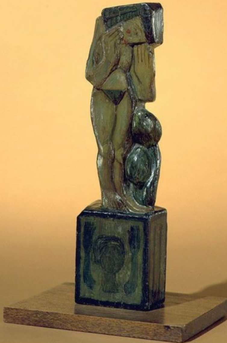
Alexander Archipenko Sorrow, 1909 Painted wood 22.6 X 6.3 X 3.7 CM.