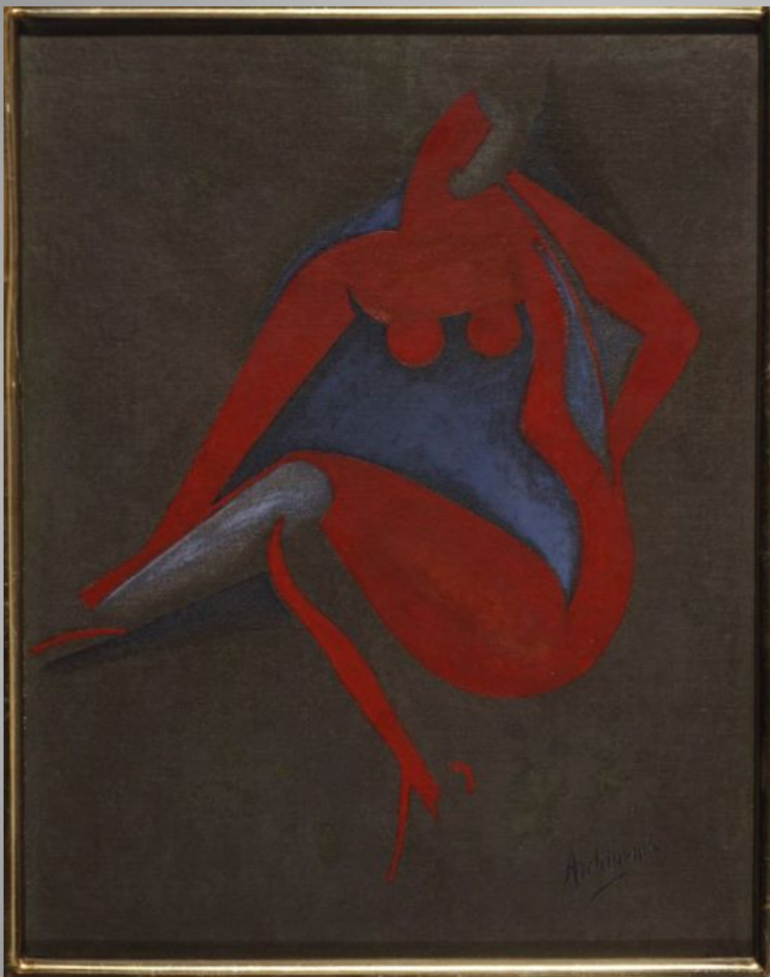
Alexander Archipenko Oil on canvas Seated Nude , (CA. 1919-1920) 32.3 X 25.1 cm