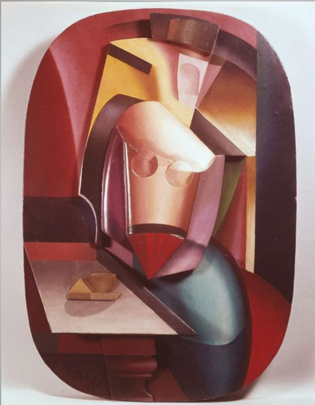
Archipenko In the Cafe A Woman with Cup, Painted canvas and 1915 Painted wood . 62.3 X 43.2 X 8.8 cm