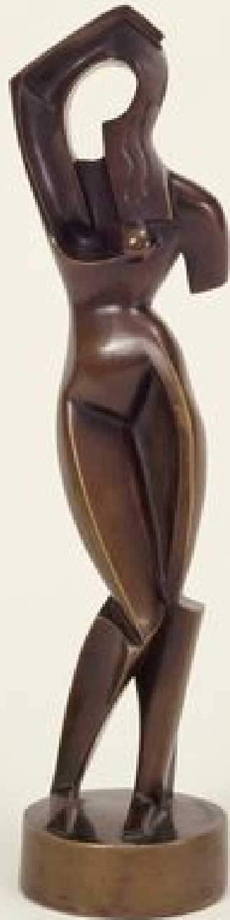
Woman Combing Her Hair 1915