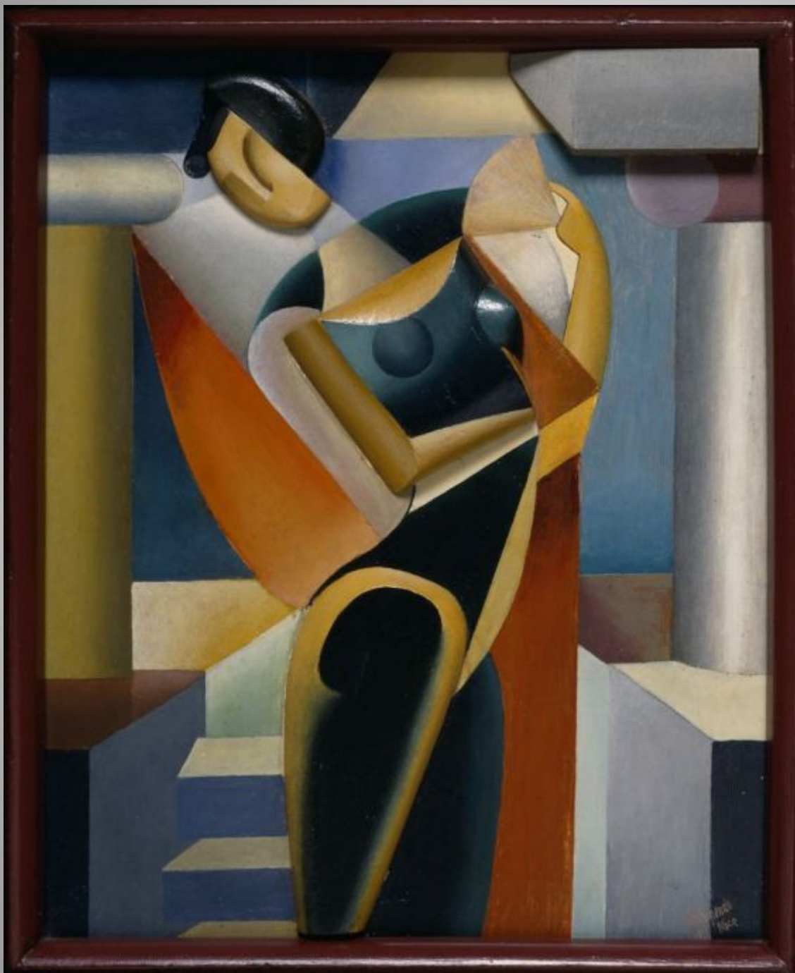
Archipenko Woman with a Fan II, 1915 Painted fiberboard and painted wood 46.0 X 37.5 X 2.4 CM