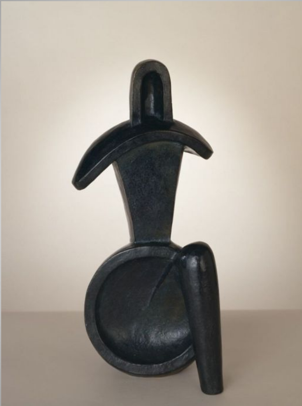
Alexander Archipenko Seated Geometric Figure, Bronze 1950s/CAST by 1967 45.0 X 22.5 X 14.0 CM