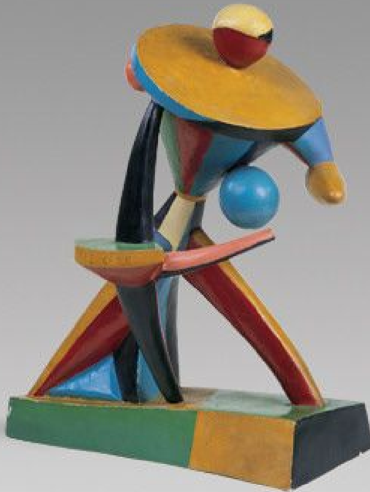
Alexander Archipenko Carrousel Pierrot 1913 Painted plaster, 61 x 48.6 x 34 cm. . Solomon R. Guggenheim Museum, New York