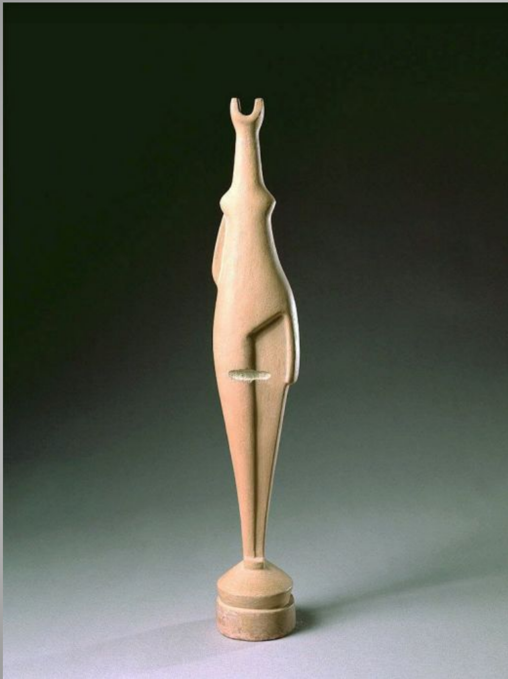
Archipenko Vase Figure, 1918 Painted cast stone 47.6 x 8.4 x 8.7 cm