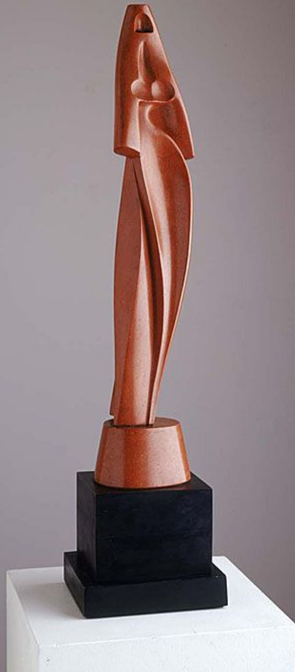
Arabian 1930-40 Terra cotta high: 24 inc