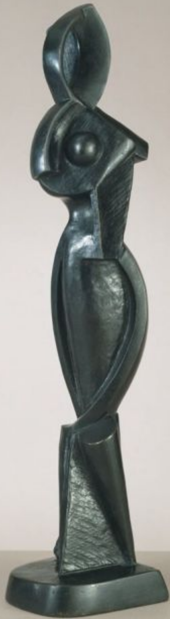
Archipenko Standing Woman, Second Version, 1914 Bronze (probably CAST 1950s) 50.5 X 10.8 X 13.5 CM