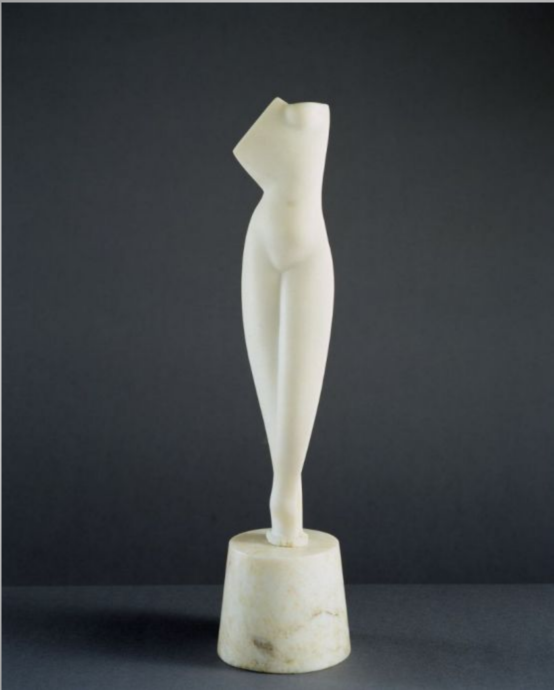
Archipenko Torso, 1914 Marble on alabaster base 47.4 X 11.5 X 11.3 CM.