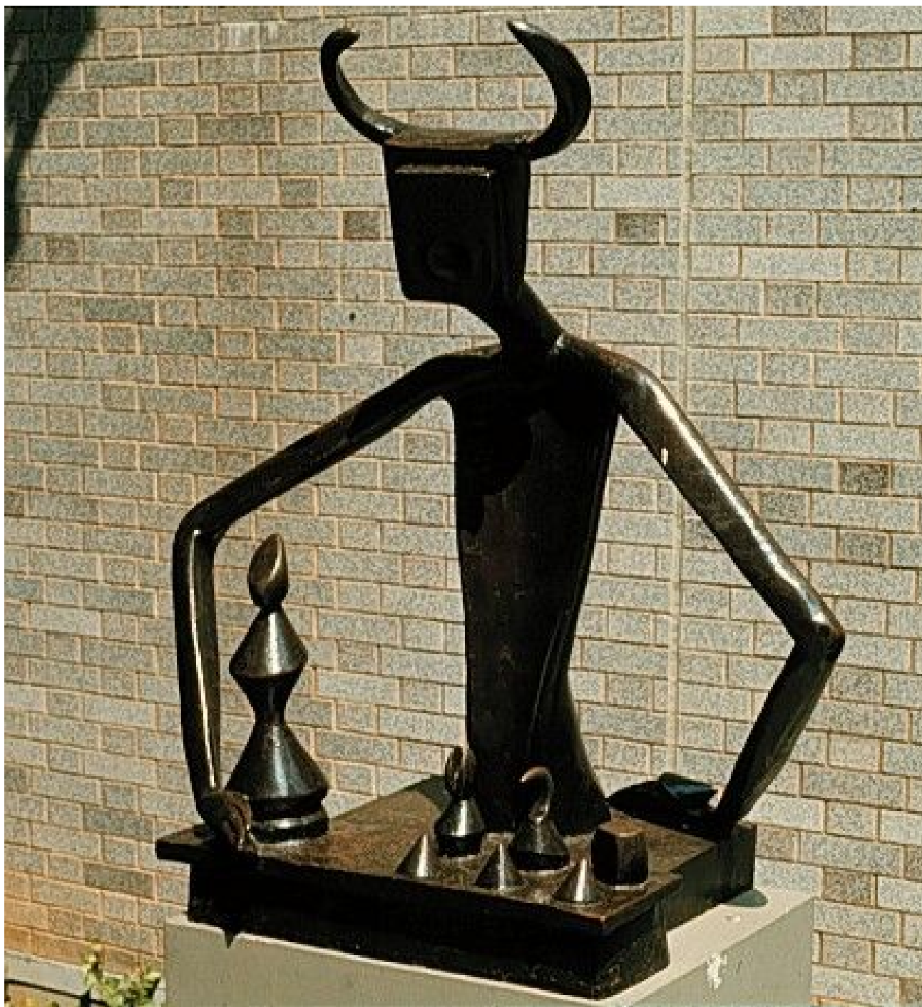
Max Ernst: The King Playing with the Queen, 1954 Museum of Modern Art, NY