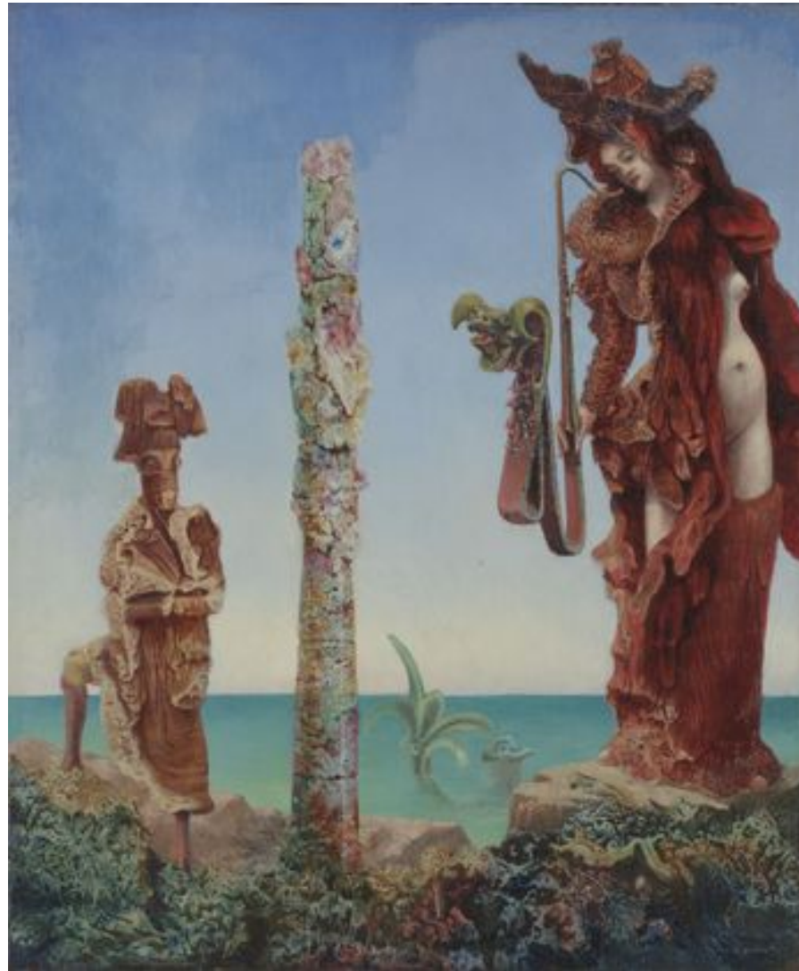
Napoleon in the Wilderness 1941