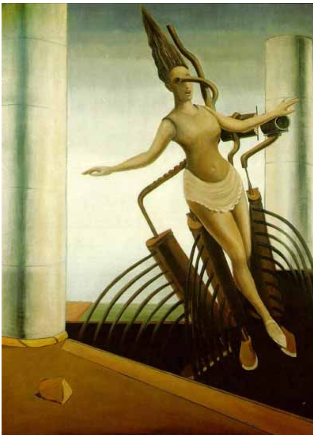
Max Ernst (1891-1976) The Wavering Woman 1923 Oil on canvas 130.5 x 97.5 cm Kunstsammlung Nordrhein- Westfalen, Dusseldorf