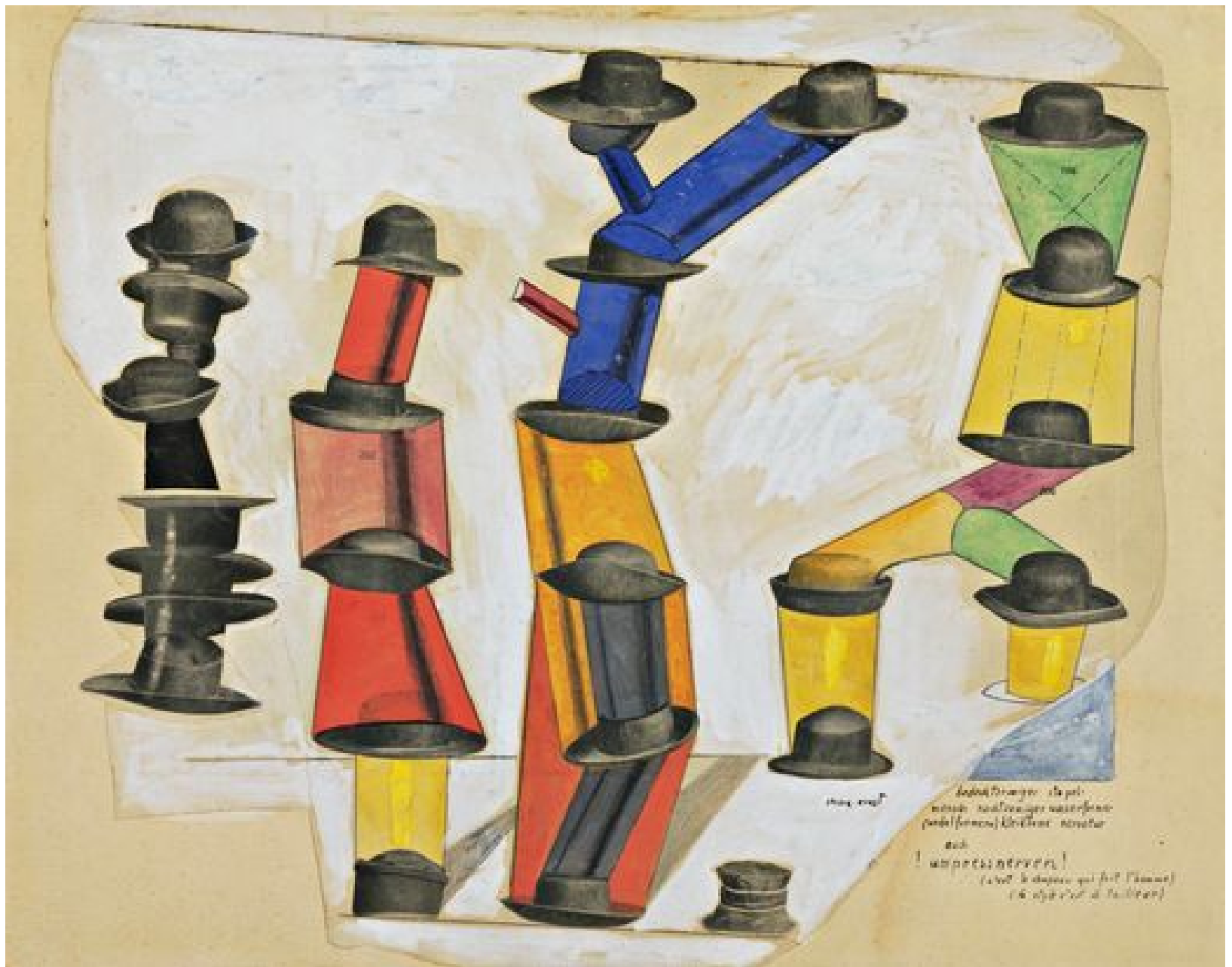
Max Ernst 1891-1976 The Hat Makes the Man . 1920. Gouache and pencil on cut-and-pasted printed paper on board with ink inscriptions, 35.6 x 45.7 cm