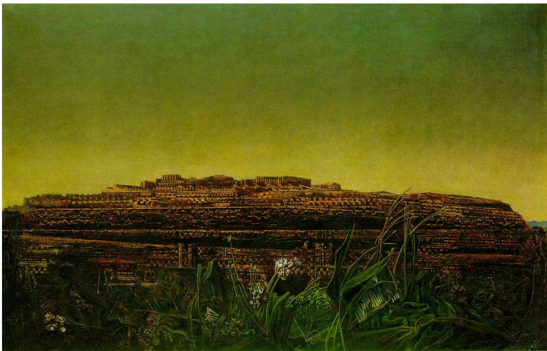
Max Ernst (1891-1976) The Entire City 1933/36 Oil on canvas 97 x 145 cm Private collection