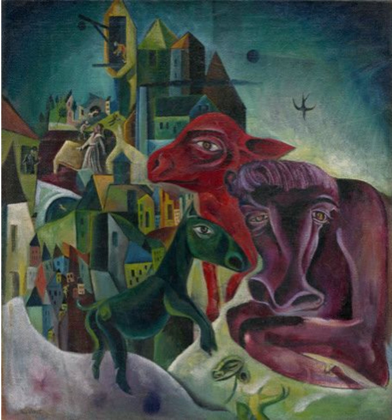
City with Animals ca. 1919. Oil on burlap, 66.6 x 62.3 cm.