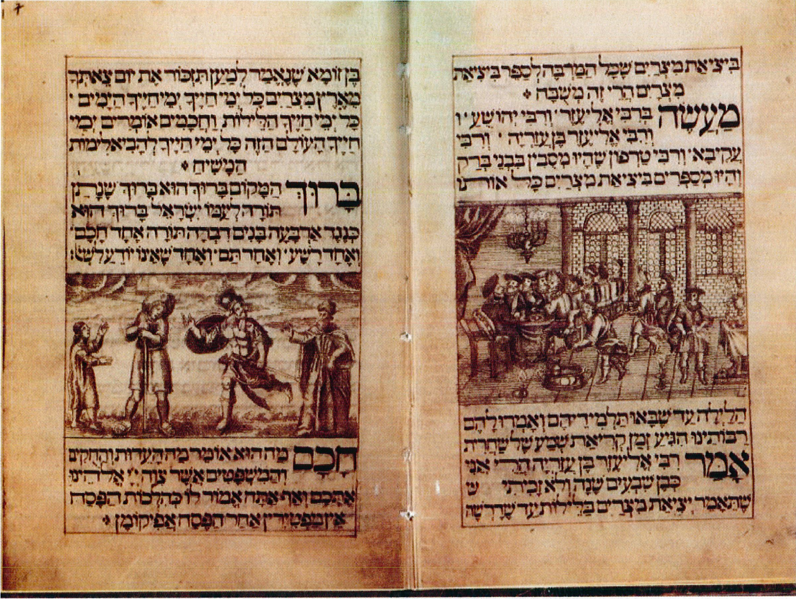
בדף הכפול בית המדרש של רבי אליעזר ותלמידיו בציודו הימני, התיאור מתייחס לסביבת בית של המאה ה-17 בהולנד, מבחינת עיצוב הפנים, החלון, המנורה, ההסבה לשולחן והכלים. לבושם של התלמידים אף הוא בנוסח המקובל באותה תקופה בהולנד. בעמוד השמאלי מופיע תיאור ארבעת הבנים: החכם מוצג בדמות חכם מזרחי מימה"ב, הרשע בדמות איש צבא עם מגן ורומח אופייני למאה ה-16, התם לבוש כרועה ושאינו כילד קטן.