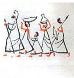
היום אתם יוצאים בחודש האביב

הגדה של פסח. הוצאת המחלקה לתרבות הקבוץ הארצי 1964. * 22*12.5 ס"מ. ציורים וכתב: שמואל כץ.