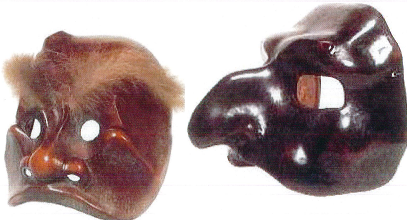
מסיכת "פולצינלה", 1957, מעור. מסיכת "ארלקינו", 1968, מעור.