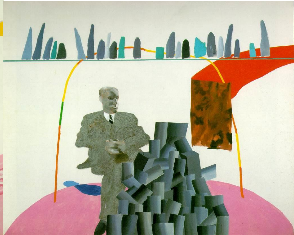
Hockney David (1937-) Portrait Surrounded by Artistic Devices 1965 Acrylic on canvas 153 x 183 cm Arts Council of Great Britain