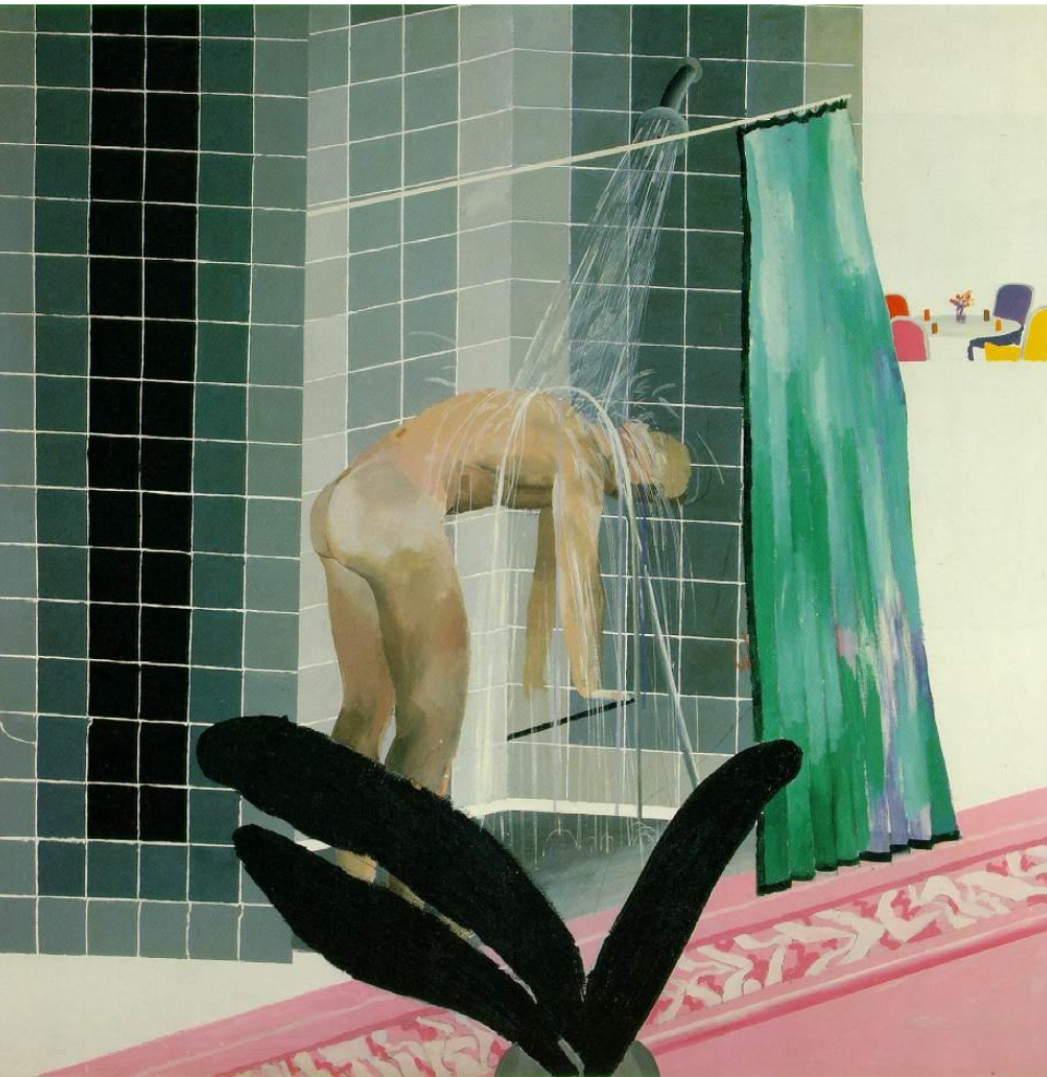
Hockney David (1937-) 1964 Man Taking Shower in Beverly Hills 167 x 167 cm Acrylic on canvas Tate Gallery, London