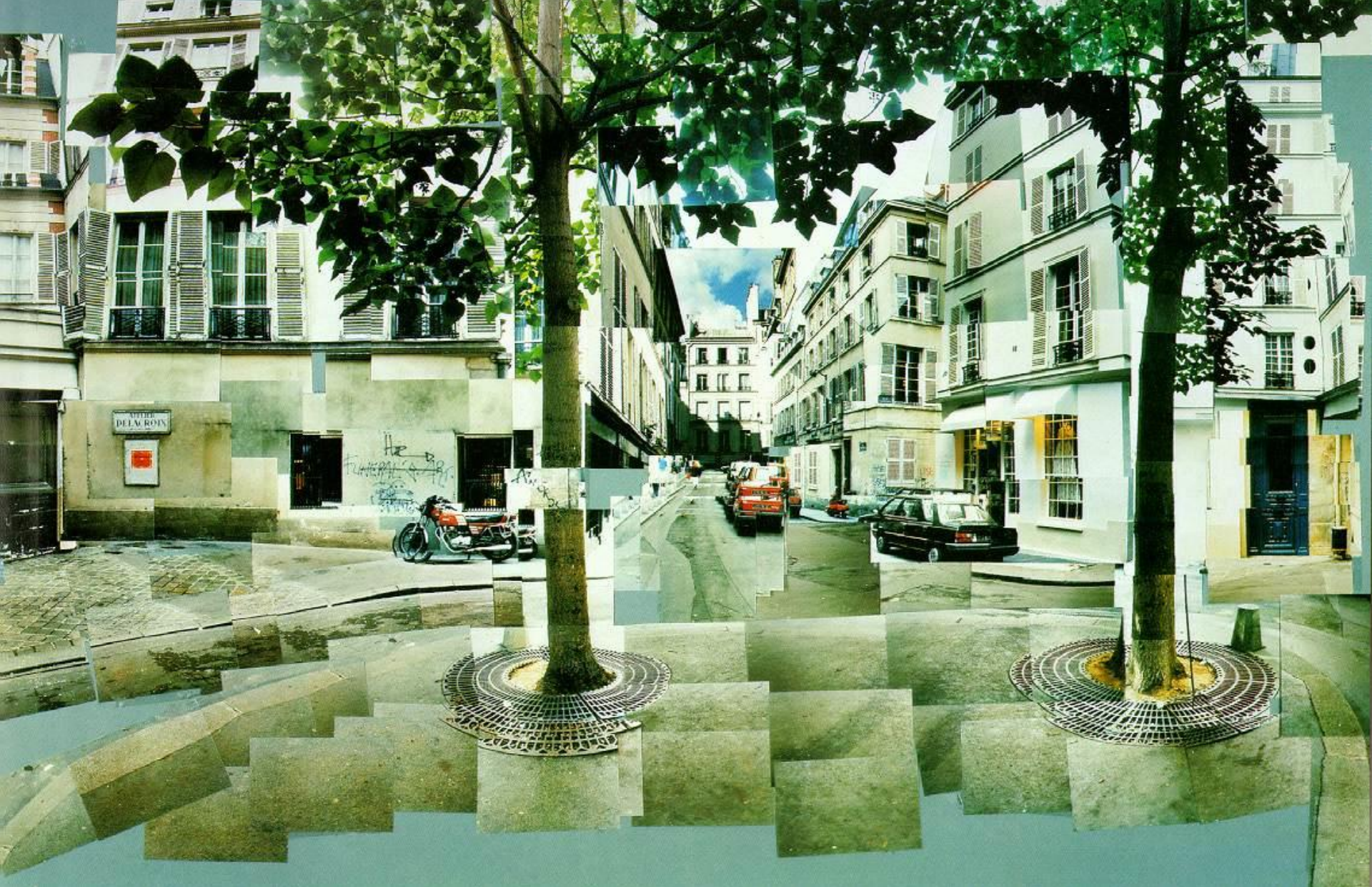
Hockney Place Furstenberg, Paris, 1985 Photographic collage 88.9 x 80 cm Collection of the artist