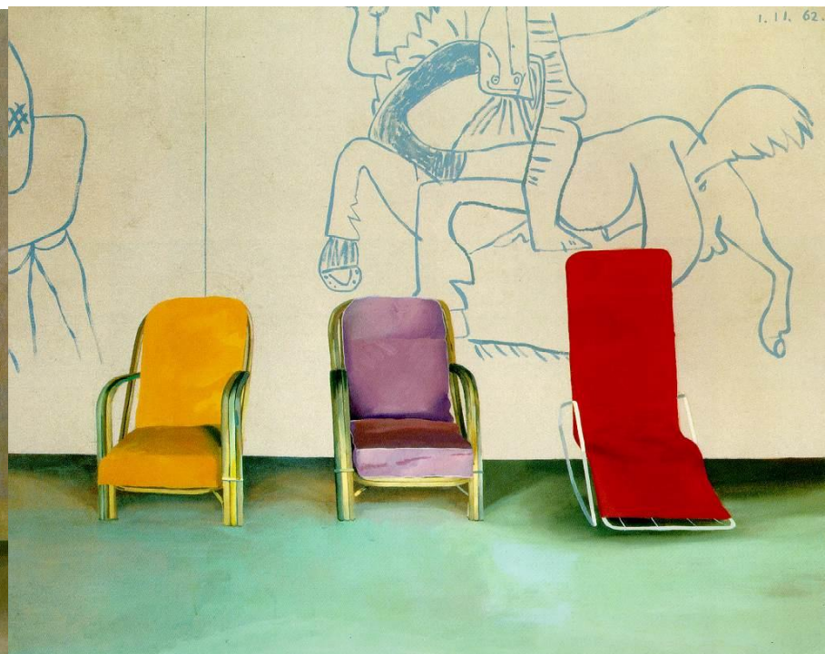
Hockney David 1937 Three Chairs with a Section of a Picasso Mural 1970 Acrylic on canvas 122 x 152.4 cm Collection of Mr. and Mrs. Ahmet Ertegun