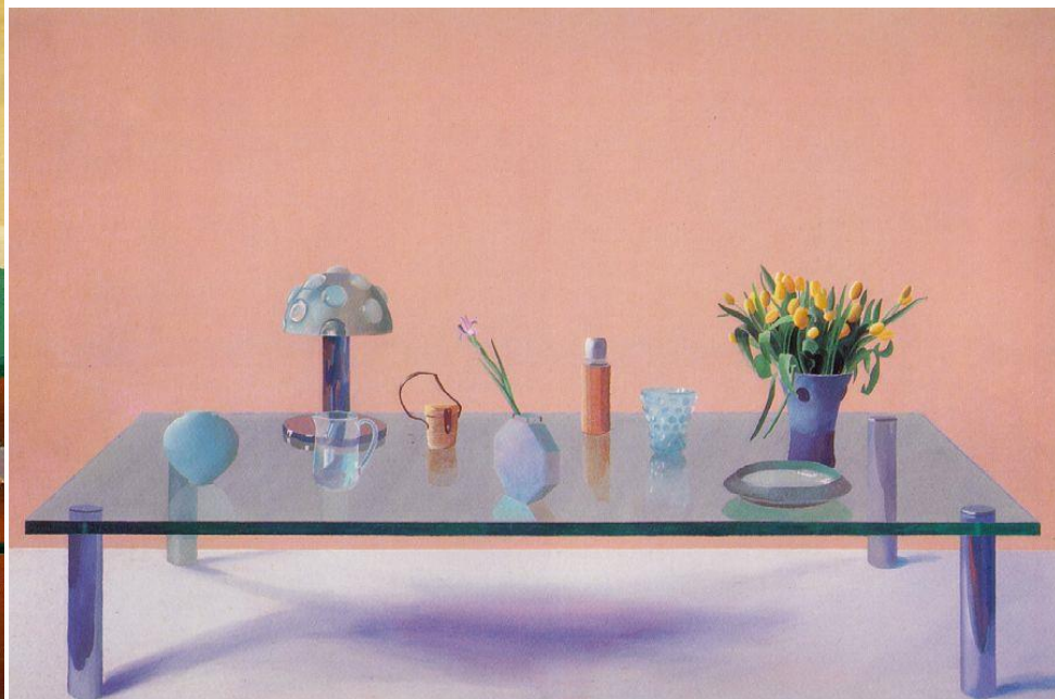
Hockney Still Life on a Glass Table 1971-72 Acrylic on canvas 183 x 274.4 cm Private collection