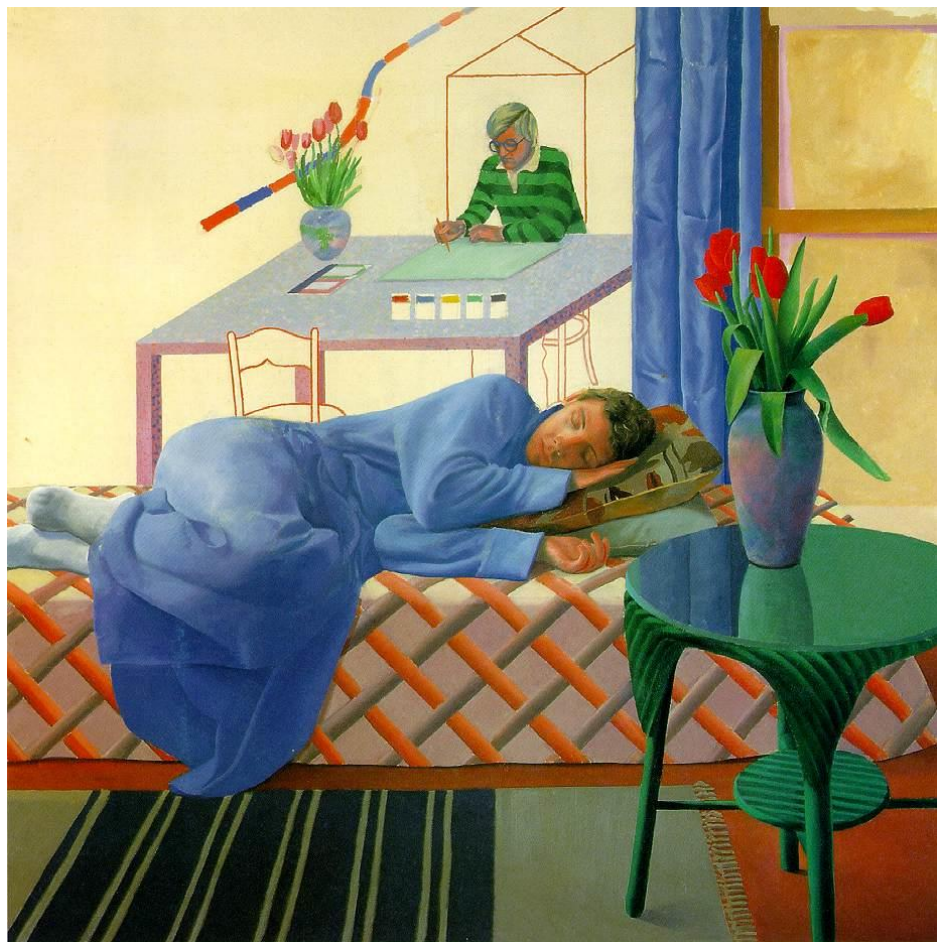
Hockney David 1937 Model with Unfinished Self-Portrait 1977 Oil on canvas 152 x 152 cm Private collection