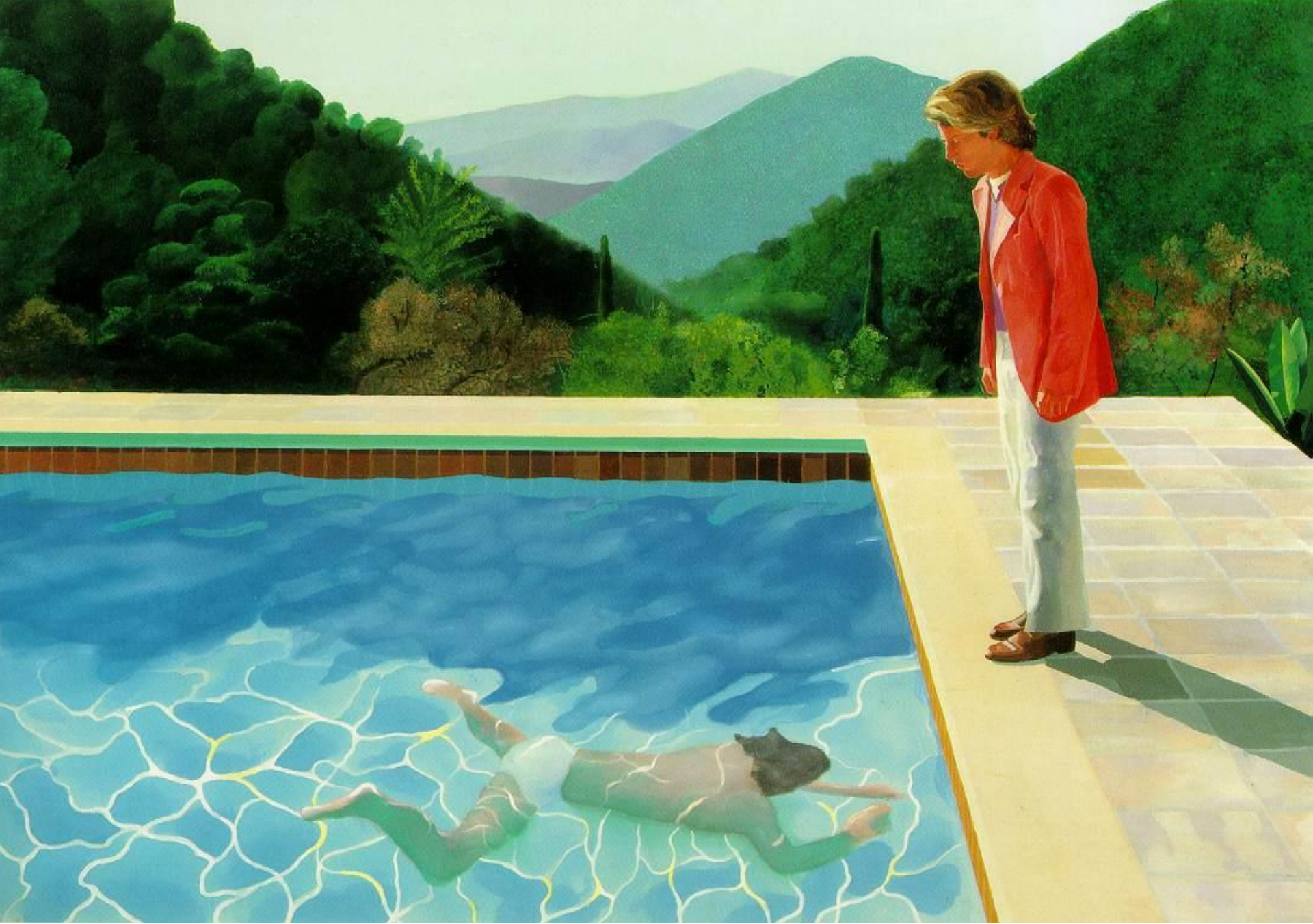
Hockney Portrait of an Artist (Pool with Two Figures) 1971 Acrylic on canvas 214 x 304.8 cm.