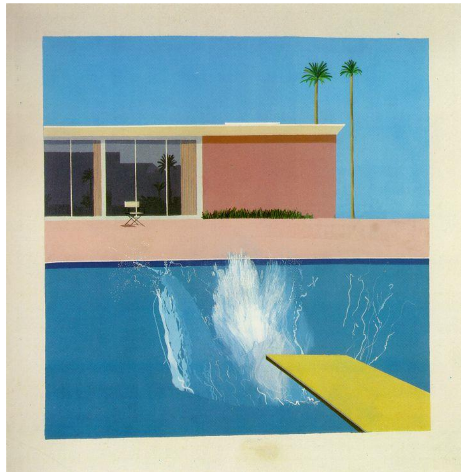
Hockney David (1937-) A Bigger Splash 1967 Acrylic on canvas 243.8 x 243.8 cm Tate Gallery, London