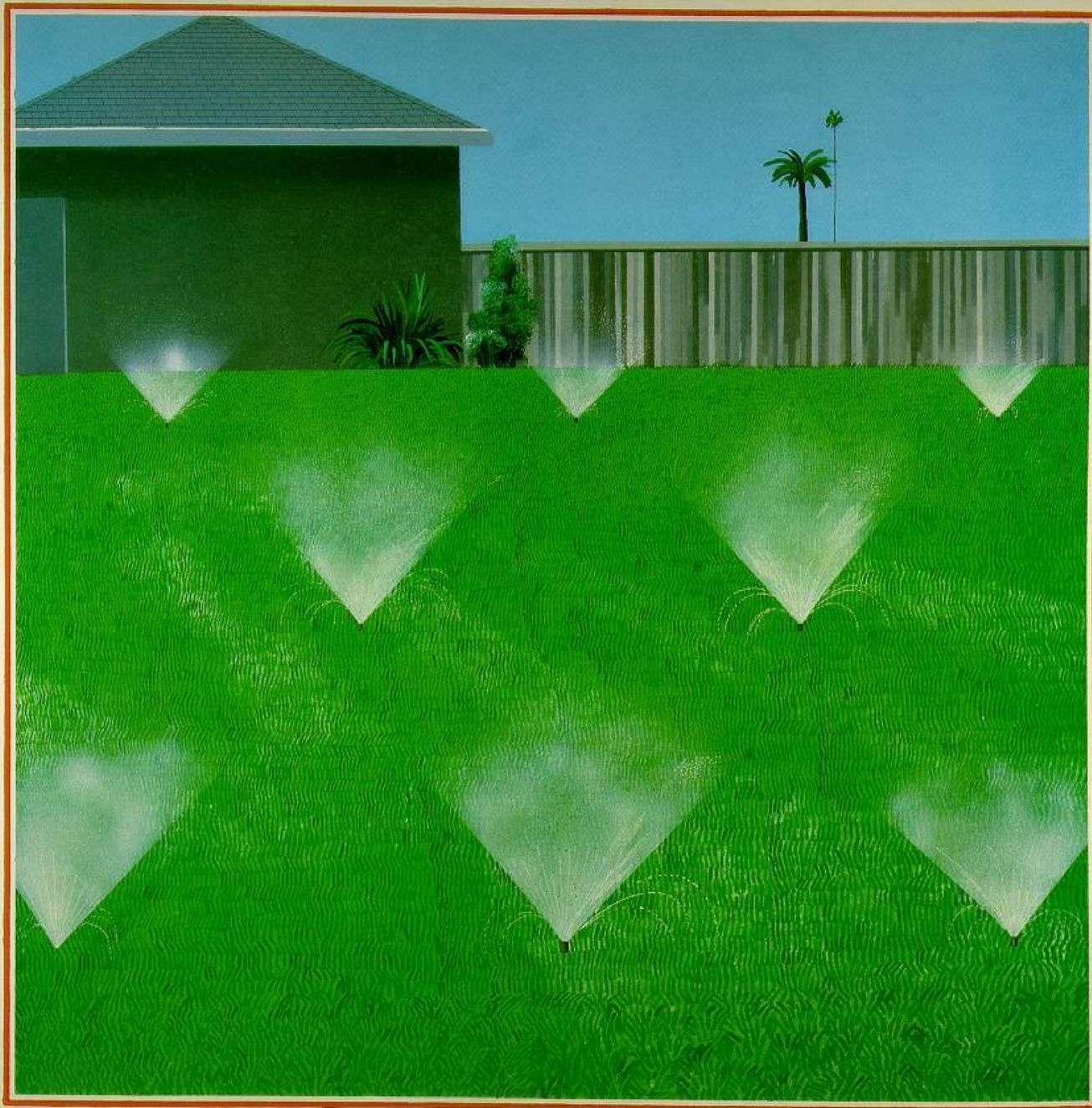
Hockney David 1937- A Lawn Being Sprinkled 1967 Acrylic on canvas (153 x 153 cm) private Collection