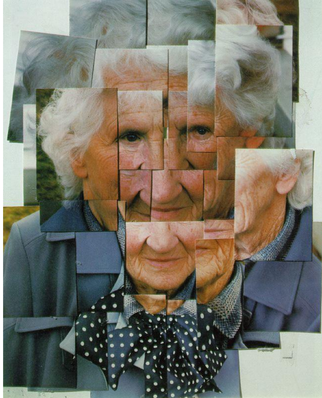
Hockney Mother I, Yorkshire Moors, 1985 Photographic collage 47 x 33 cm Collection David Hockney