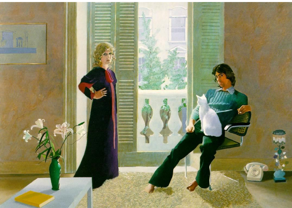
Hockney David 1937 Mr and Mrs Clark and Percy 1970 Acrylic on canvas 304 x 213 cm