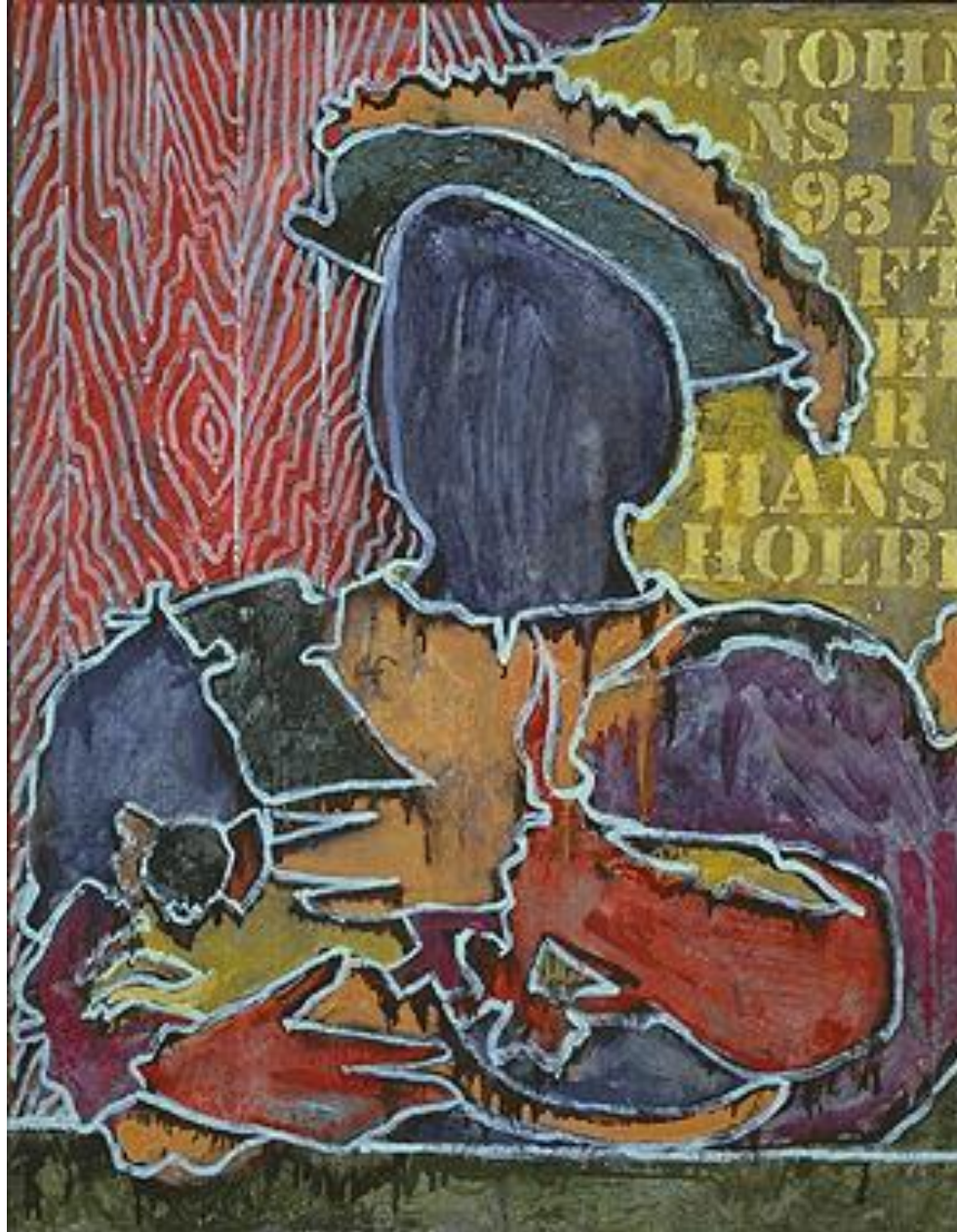
JASPER JOHNS After Hans Holbein . 1993 Encaustic on canvas (82.7 x 65.1 cm) Private collection