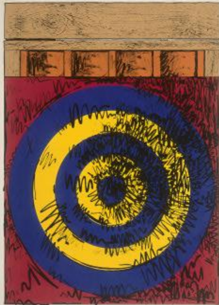
American, born 1930 1968, Target with Four Faces color screenprint on RIVES BFK paper, 111.6 x 81.7 cm