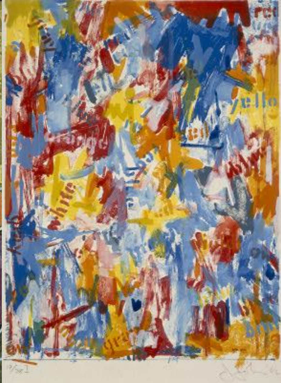
JASPER JOHNS American, born 1930 1962, False Start I .color lithograph (stone) on Rives BFK paper, image: 45.72 x 35.56 cm