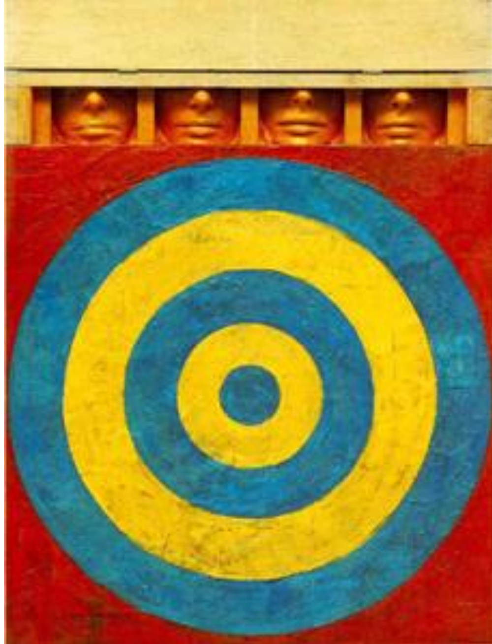
JASPER JOHNS Target with Four Faces