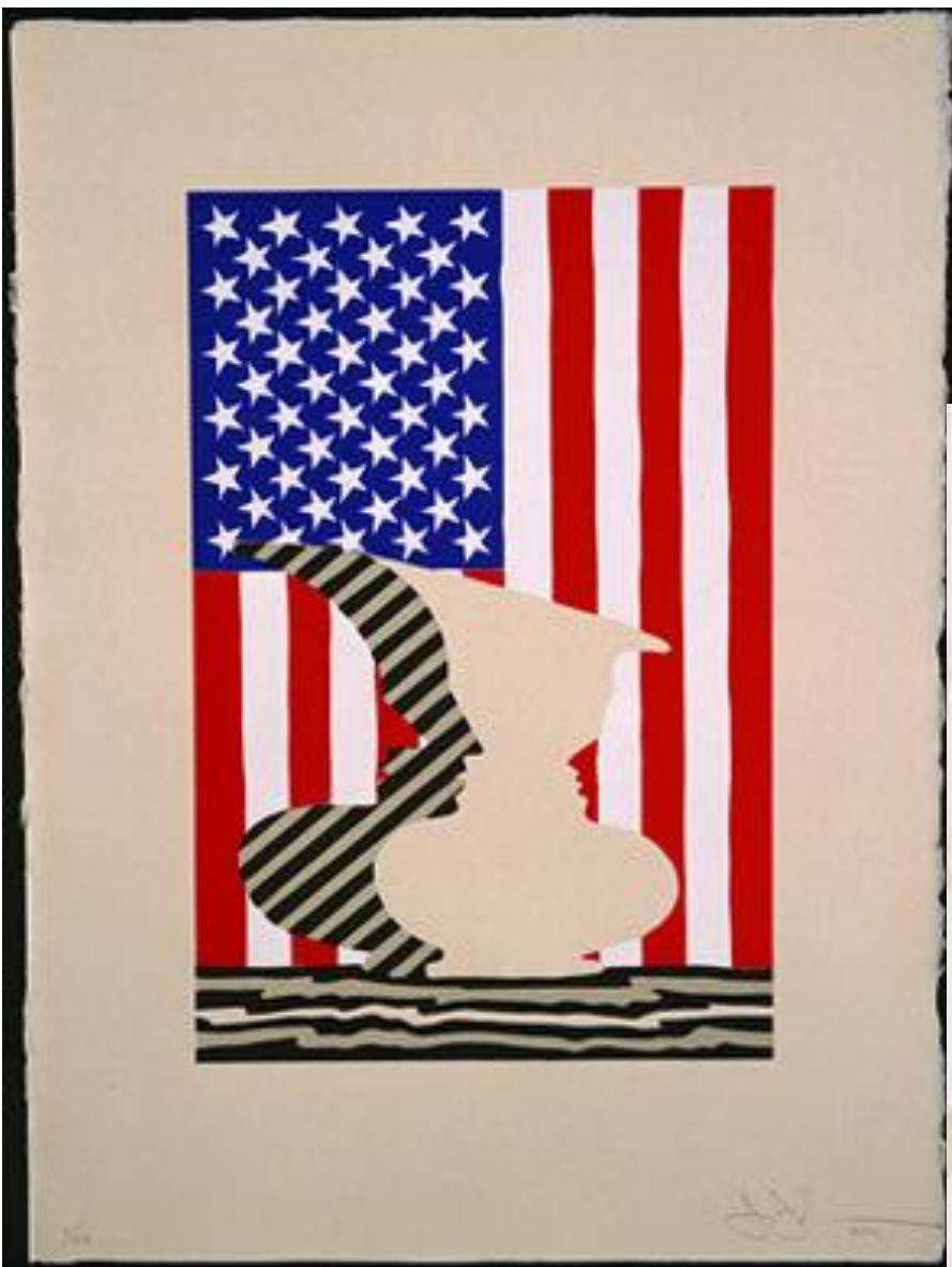
JASPER JOHNS American, born 1930 2000 , Untitled color linoleum cut on wove paper, . image: 40.4 x 27 cm sheet: 57.15 x 42.55 cm