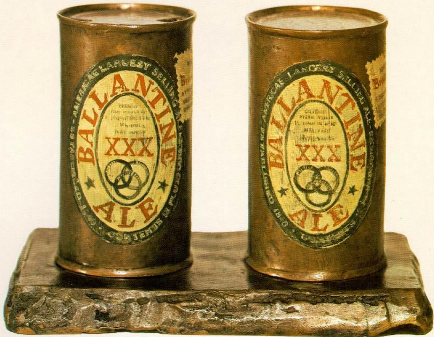
JASPER JOHNS Painted bronze