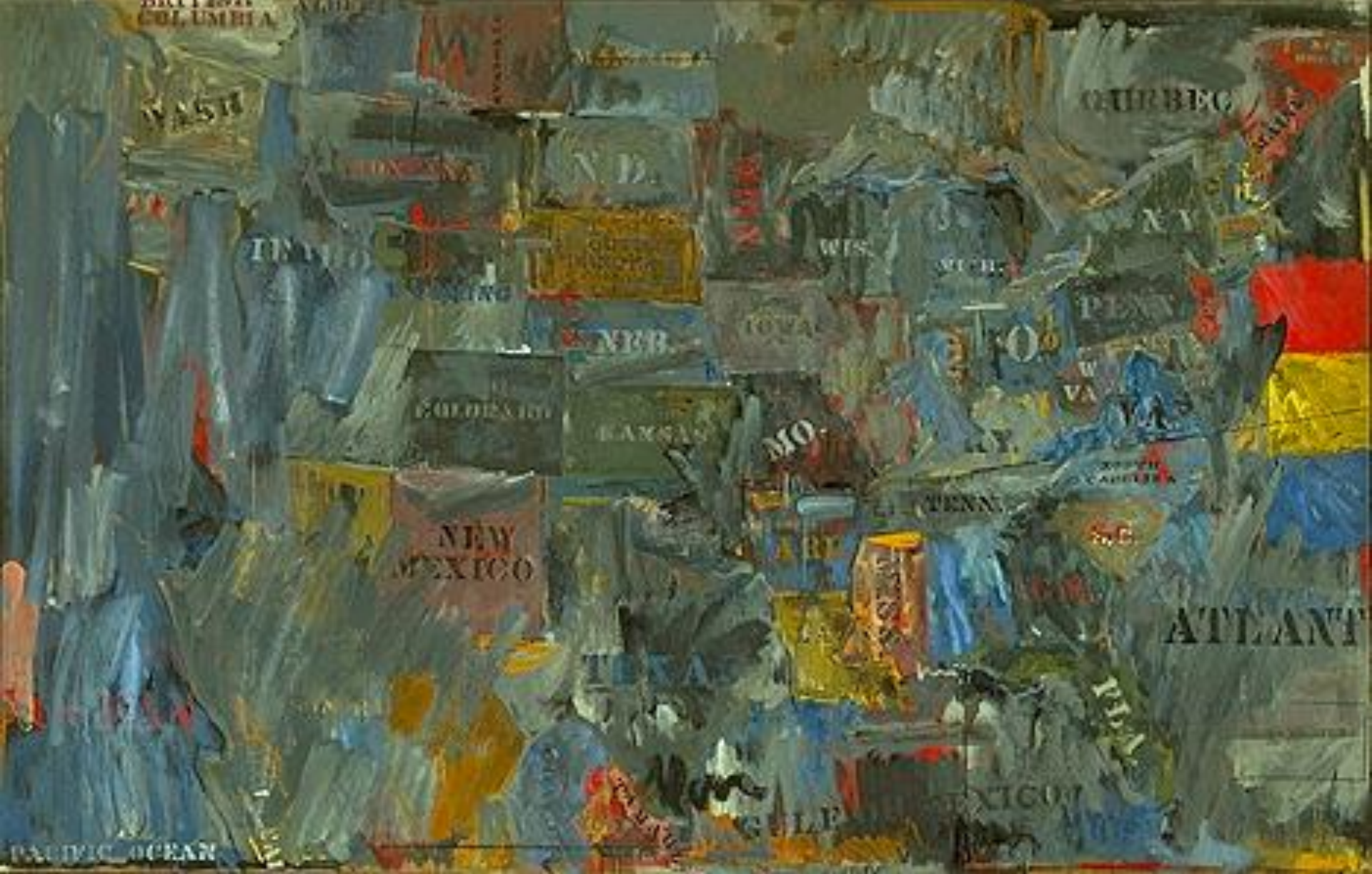
JASPER JOHNS Map . 1963 Encaustic and collage on canvas 152.4 x 236.2 cm, Private collection