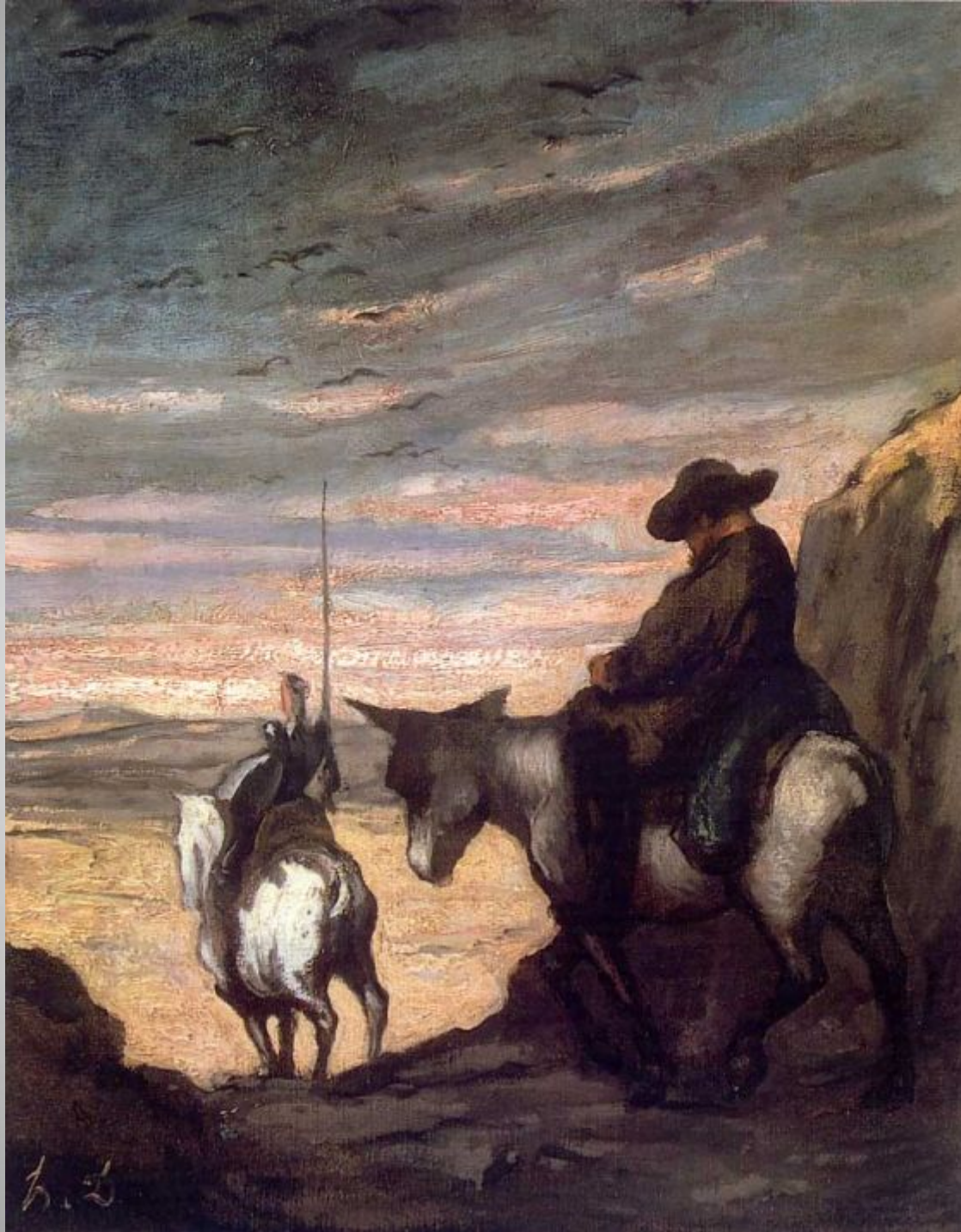
Don Quixote and Sancho Panza c. 1866-68 Oil on canvas 40.2 x 33 cm The Armand Hammer Museum of Art and Cultural Center, Los Angeles