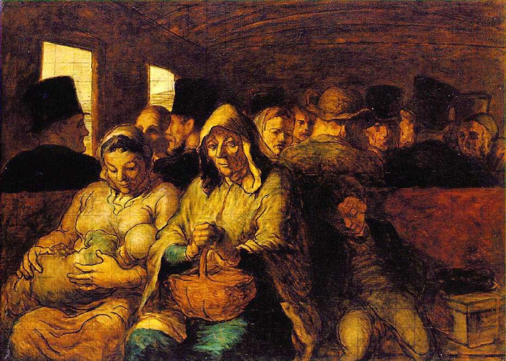
1863-65 The Third-Class Carriage Oil on canvas 65.4 x 90.2 cm The Metropolitan Museum of Art, New York