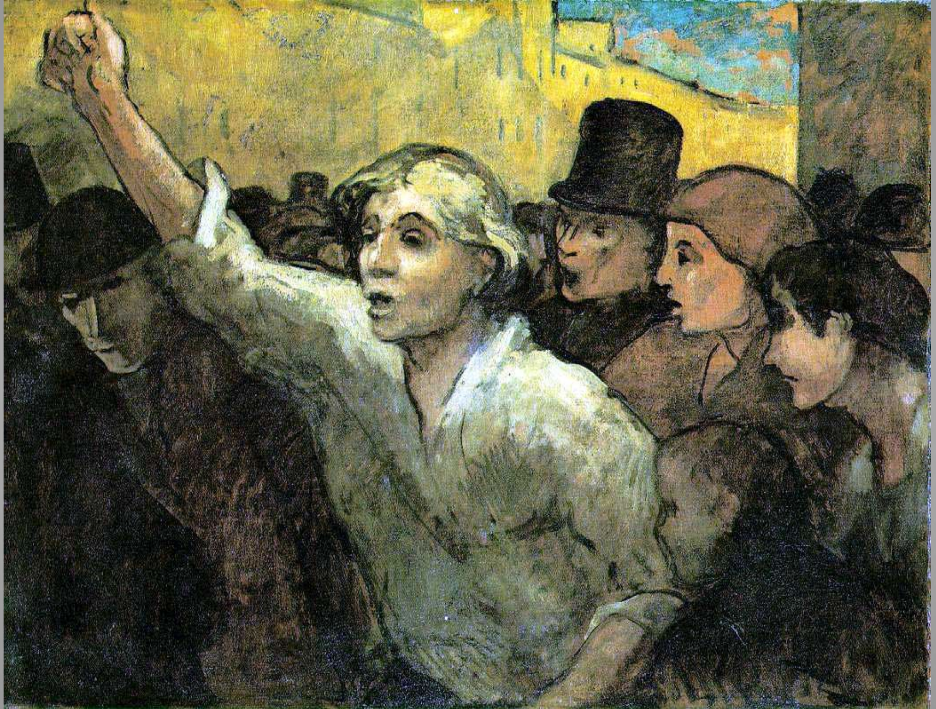
The Uprising c. 1860 Oil on canvas. 87.6 x 113 cm The Phillips Collection, Washington, D.C.