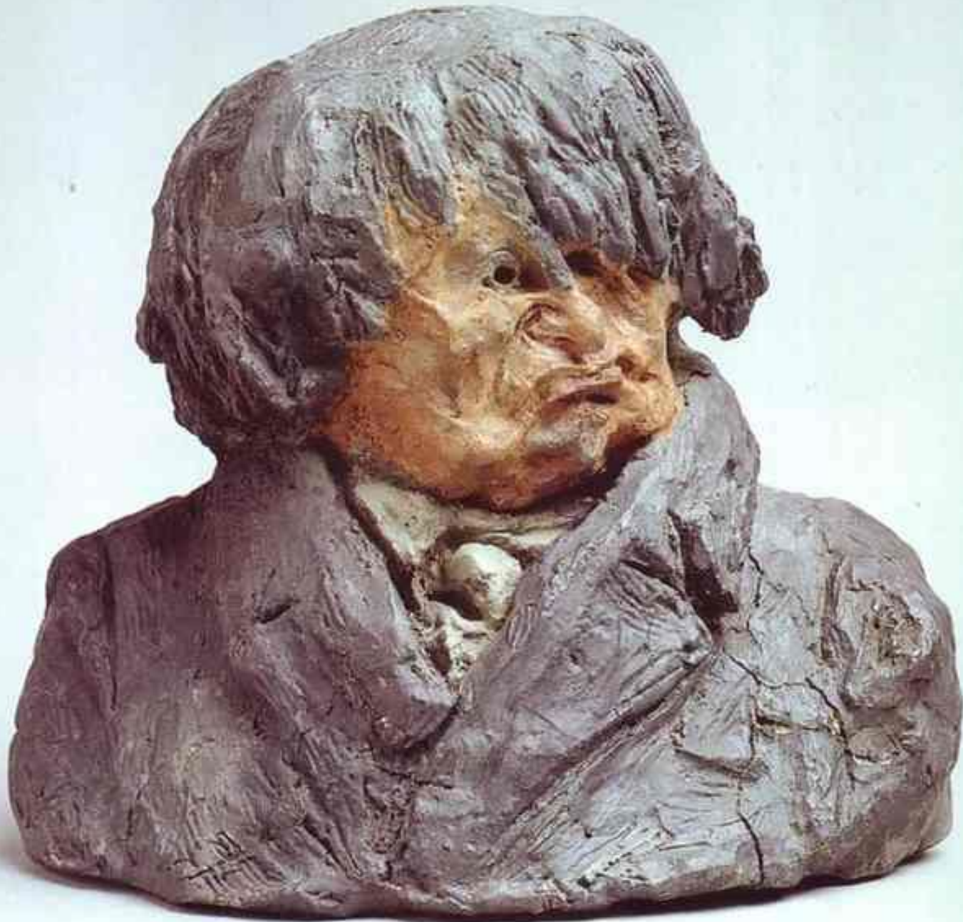
Honore Daumier .c.1832 Clément-François- Victor-Gabriel Prunelle (1774- 1853), Doctor, Major of Lyon and .Deputy . Colored clay. Musée d'Orsay, Paris, France H. 0.314 ; L. 0.152 ; P. 0.159