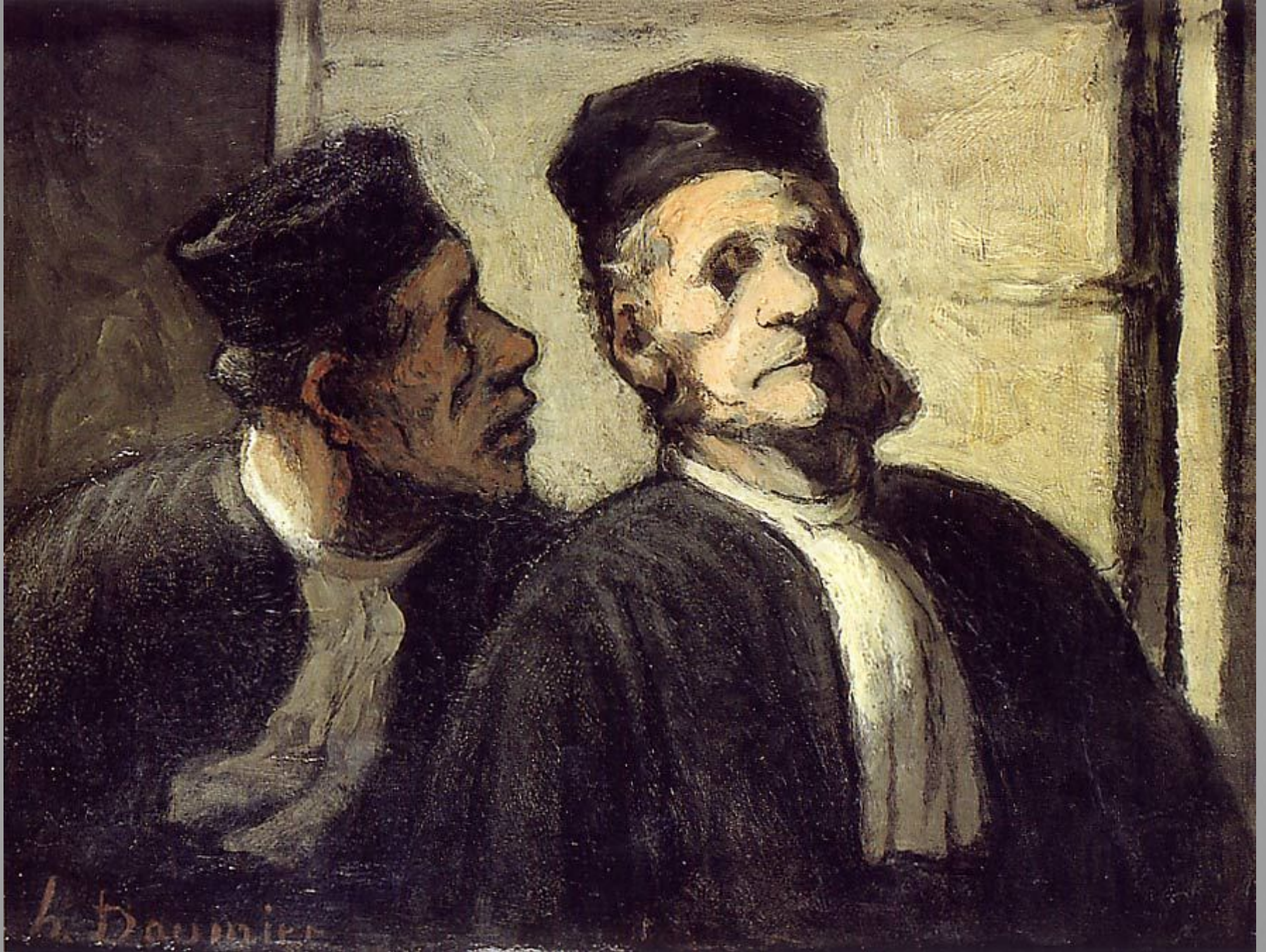
The Two Lawyers c. 1862-64 Oil on panel Stiftung Sammlung E. G. Bührle, Zurich 20.5 x 26.5 cm