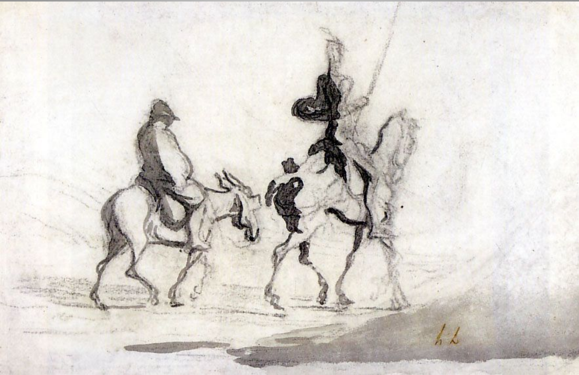
Don Quixote and Sancho Panza c. 1850 Black crayon and wash 16 x 22 cm The Metropolitan Museum of Art. New York