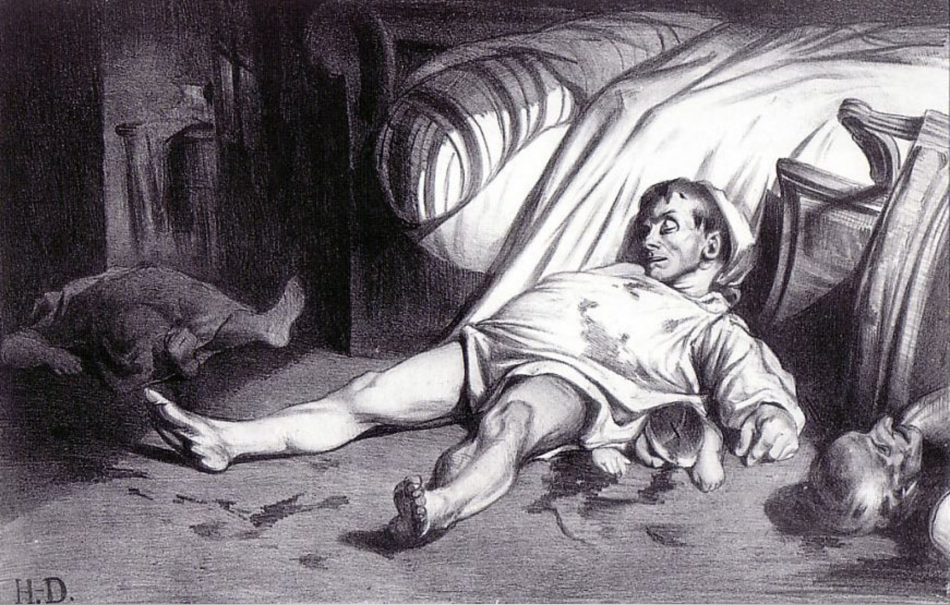
Rue Transnonain, I 1834 L'Association mensuelle Lithograph 28x 44 cm Association des amis de Honoré Daumier