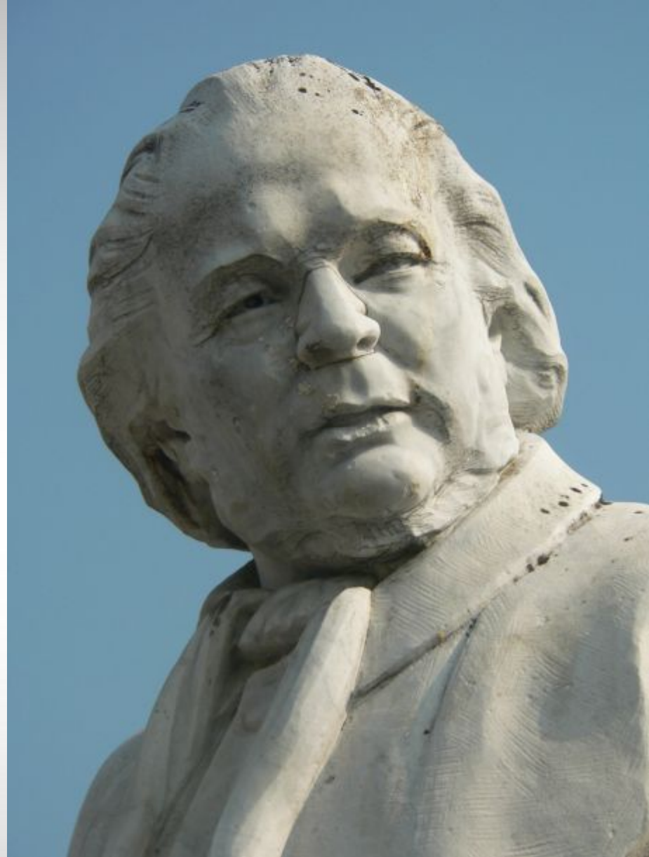
Daumier Honoré by Adolphe-Victor Geoffroy-Dechaume 1816-1892