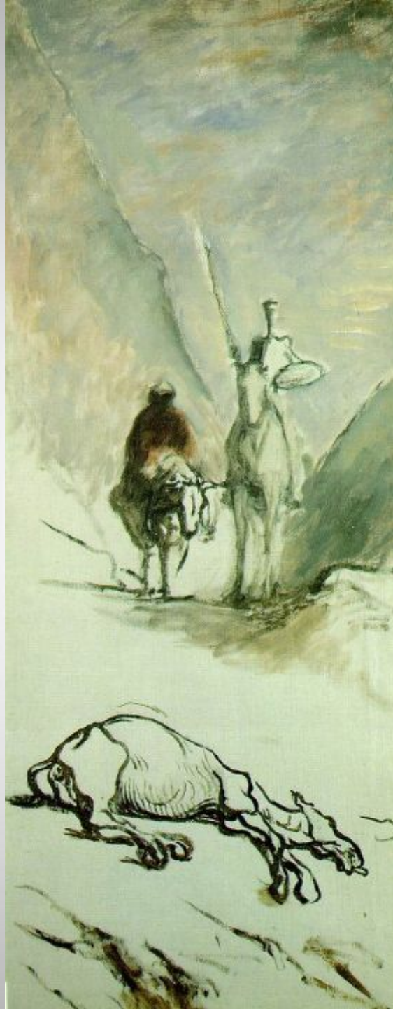
Don Quixote and the Dead Mule 132.5 x 54.5 cm, 1867 Musée d'Orsay, Paris