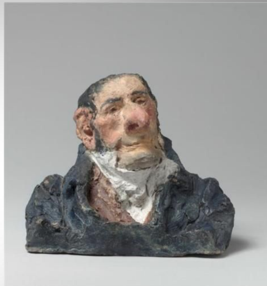
Count Antoine-Maurice-Apollinaire d'Argout (1782-1858), Minister and Peer of France, 1832