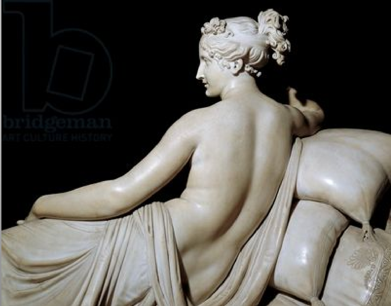
Detail from statue of Pauline Borghese as Venus

הגו החשוף מבליט את יופיה, שליטתו של קנובה בחומר בולטת בתנועת המותן ובקימור הגו שיוצר אשליה של חיים בדמות. קפלי הבד ורקמת הכרים מוסיפים מהימנות לתיאור