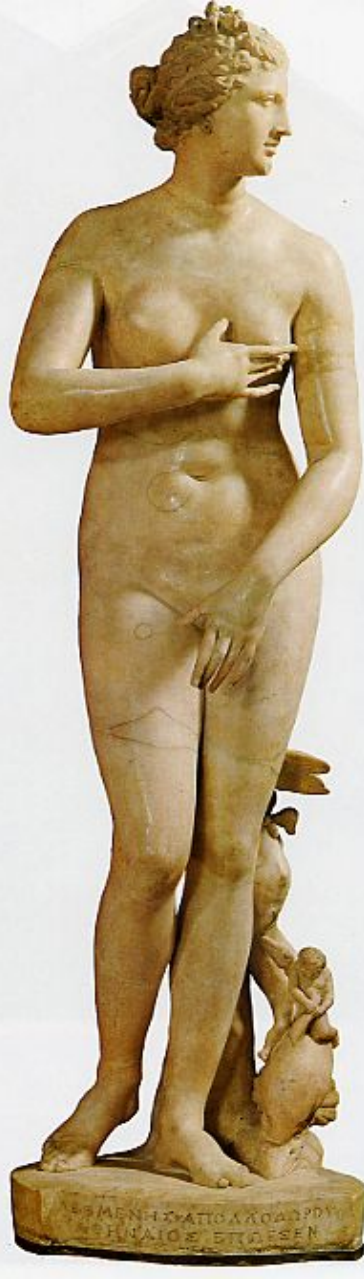
Medici Venus is a Hellenistic marble 1.53m depicting the Greek goddess of love Aphrodite. It is a 1st century BC marble copy,