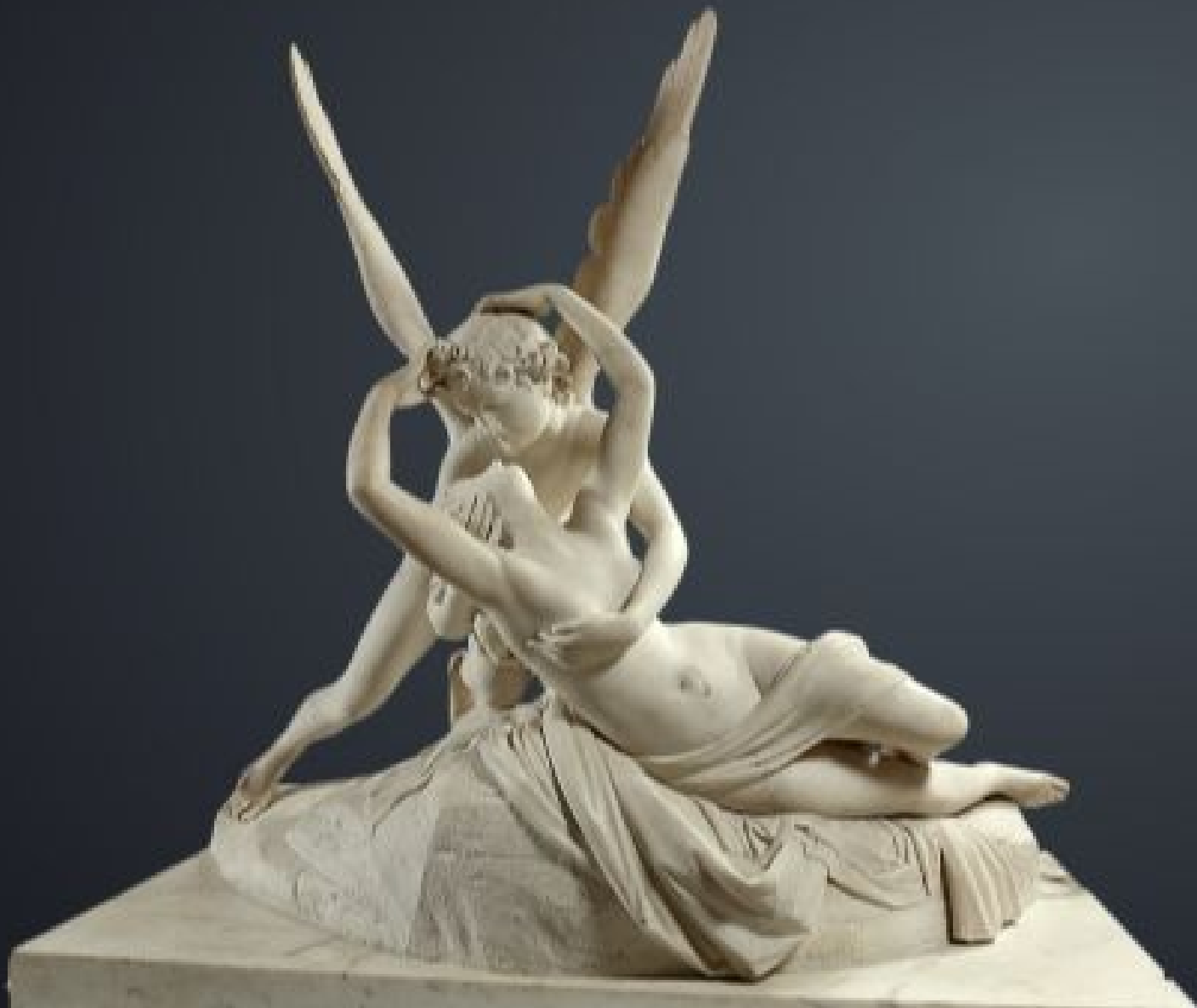
Canova, Antonio Cupid and Psyche Italy. 1796 Marble. 137 cm

תבנית הפסל כפרמיידה בה בני הזוג שלובים זה בזה, כנפיו של ארוס והרמת הטורסו של פסיכה בידייו של ארוס, יוצרים תנועה כלפי מעלה.