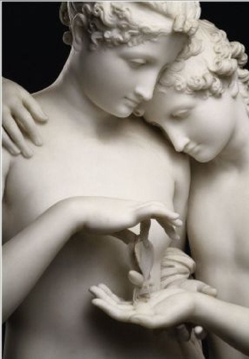
Antonio Canova, Cupid and Psyche 1796/ 1800 Marble, 150 x 68 cm Musée du Louvre, Paris

הגירסה הזקופה של פסיכה וארוס, מבוססת על הגרסה הקלאסית. בפסל הם מתוארים כזוג צעיר מאד, עומדים מחובקים ומשחקים עם פרפר. יפי גופם, המבע התמים והשלווה הנסוכה עליהם, מייצגים שלמות.