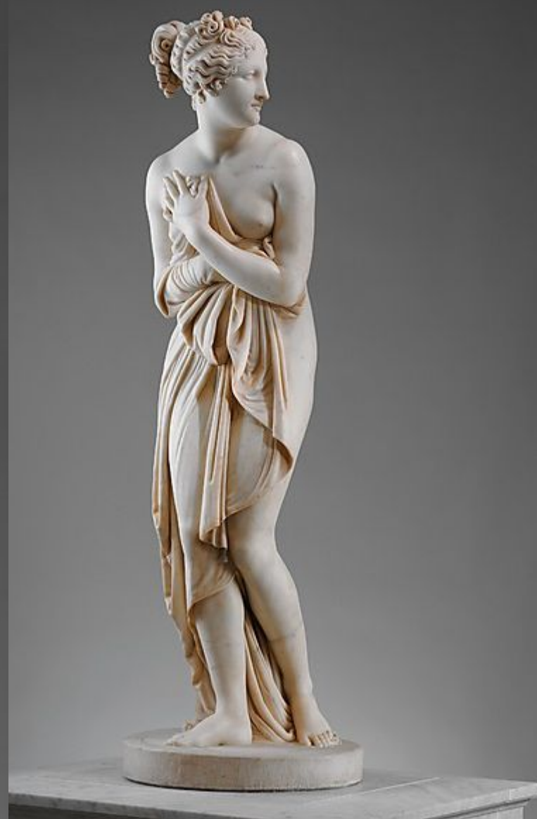
Antonio Canova Venus Italica Marble, height cm 178, 1822–23, variant of marble first executed 1810

ונוס איטליקה של קאנובה הוזמנה כמילוי מקום לונוס מדיצ'י שנשדדה על ידי נפוליאון והועברה ללונדון. (ונוס מדיצ'י היא פסל קלאסי מהמאה ה-1 לספירה, העתק לונוס קנידוס של פרכסיטלס) דמותו של קנובה עדינה, וחיונית מאד. אחד המבקרים כתב שאם ונוס מדיצ'י היא פסל האישה היפה ביותר, ונוס של קנובה היא האישה היפה ביותר. יש בה שקיפות זוהר ורכות. הפסל אינו העתק של המקור אלא מחדש בתנוחה ובקפלי הבד. השליטה של קנובה בשיש מקבילה לרכות ולטיפול בשיש הקלאסי ושל מיכאלאנג'לו