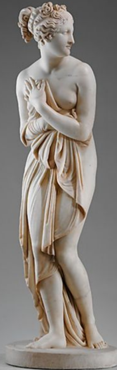
Antonio Canova Venus Marble, height cm 178, 1812