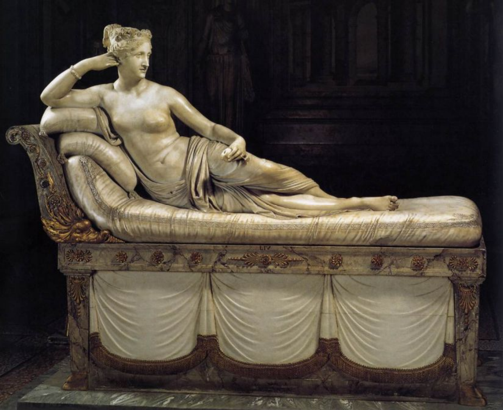
Antonio Canova, Paolina Borghese as Venus Victorious, 1804- 08, White marble, 160 x 192 cm, Galleria Borghese, Rome

פאולין בונפרט בדמות ונוס, קנובה משחזר מסורת קלאסית, הפנים מייצגות את האישיות עצמה, פיסול הגוף מועתק מנוסח רומי קלאסי. התפוח בידה, מרמז על סיפור משפטו של פאריס. הבסיס עשוי עץ, כדגם מיטה להצגת המת בעידן הקלאסי. גופה הנשי המושלם, משחק הבר וכיסויי פלג גופה התחתון מעורר כבוד וחשיפת החלק העליון מצביע על יופייה.