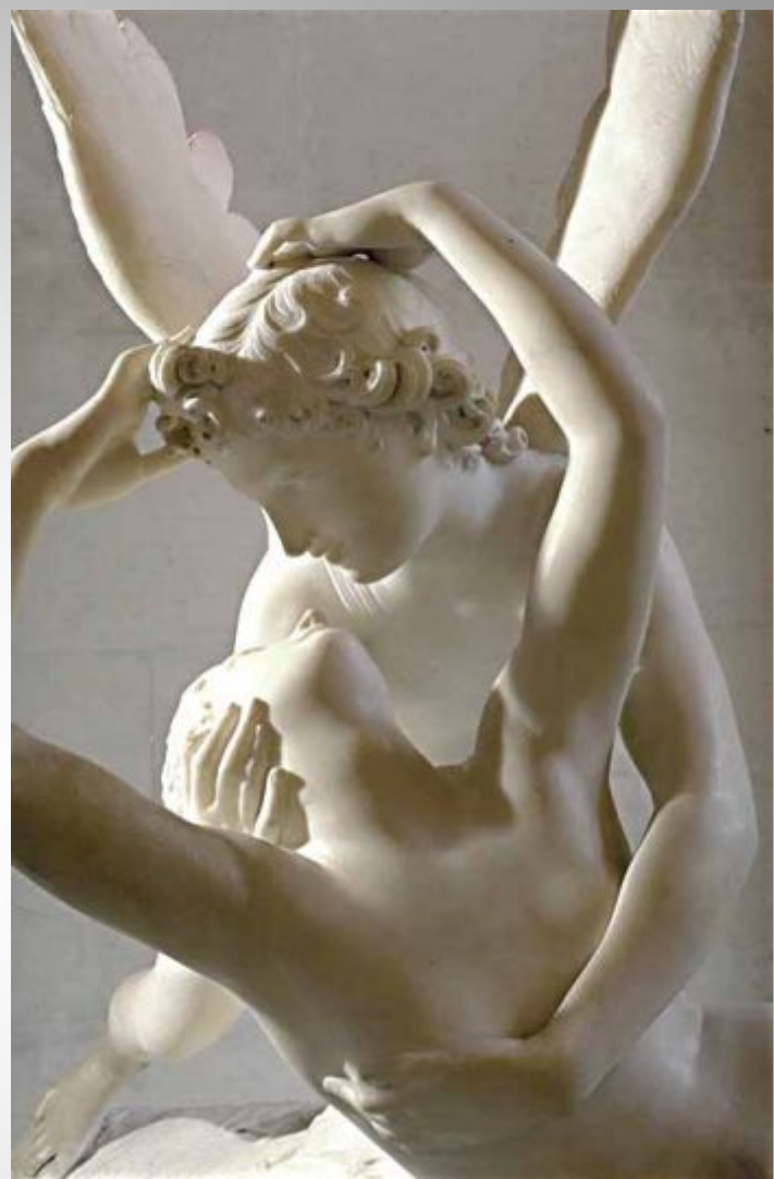
Canova, Antonio Cupid and Psyche Italy. 1796 Marble. 137 cm

תבנית הפסל כפרמידה בה בני הזוג שלובים זה בזה, כנפיו של ארוס והרמת הטורסו של פסיכה בידיו של ארוס, יוצרים תנועה כלפי מעלה. ארוס מרים את פסיכה בחיבוק עדין, פניו קרובים לפניה. פסיכה נותנת לעצמה לשקוע אחורנית ומחזיקה ברפיון את ראשו של אהובה בין ידיה. תנועת הידיים יוצרת מעין מסגרת לפני הנאהבים, רגלו השמאלית של ארוס יוצרת את העוגן לתנוחה ורגלו ימנית תומכת ומוכנה כאילו למעוף. הטיפול בשיש מעודן, ברכות ובתחושת השקיפות של עור.