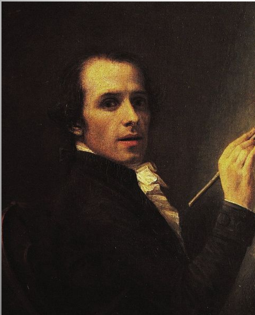
Antonio Canova Self-portrait, 1792 oil on canvas 68 x 55 cm

אנטוניו קנובה 1757 – 1822 Antonio Canova