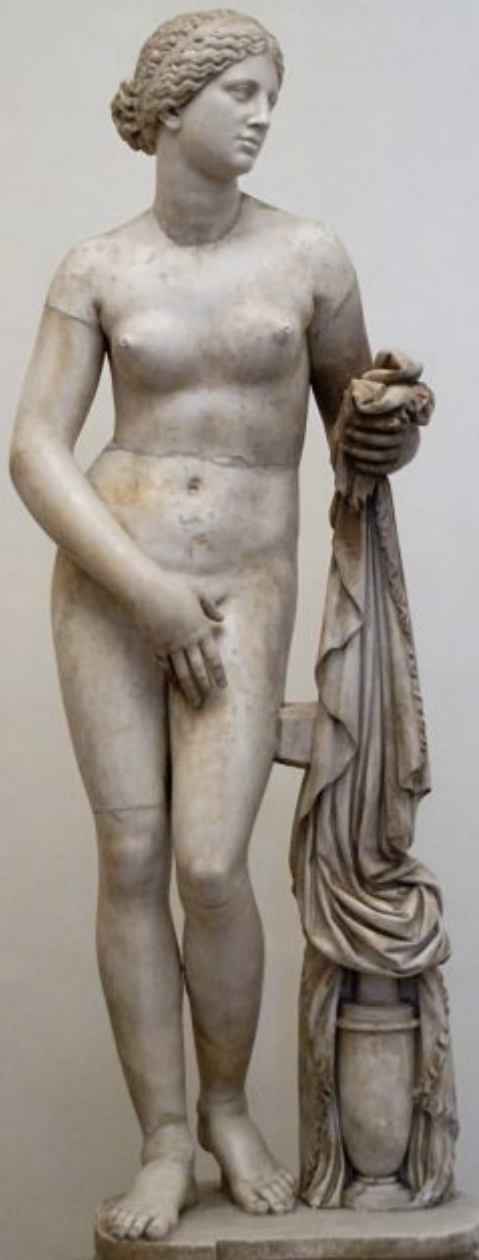
Aphrodite of Knidos was one of the most famous works of the ancient Greek sculptor Praxiteles of Athens 4th century BC. 168 cm.