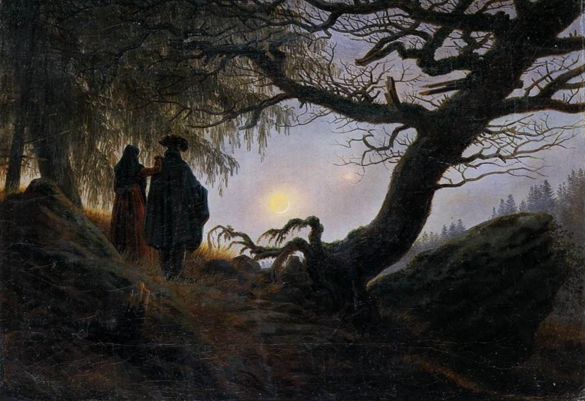
Caspar David Friedrich Man and Woman Contemplating the Moon 1824 oil on canvas 34 x 44 cm Alte Nationalgalerie Berlin

הזוג הנמצא בטבע, צופה בירח. לבושם המסורתי – כבד בולט על רקע הטבע הרוחש מסביבם. במרכז הקומפוזיציה הירח וההילה סביבו, מפיצים אור חיוור על הנוף הכהה. ענפי העץ החשופים מימין, הזוג והעץ עם העלווה משמאל, יוצרים מעין מעין כהה שמבליט את השמים והירח.