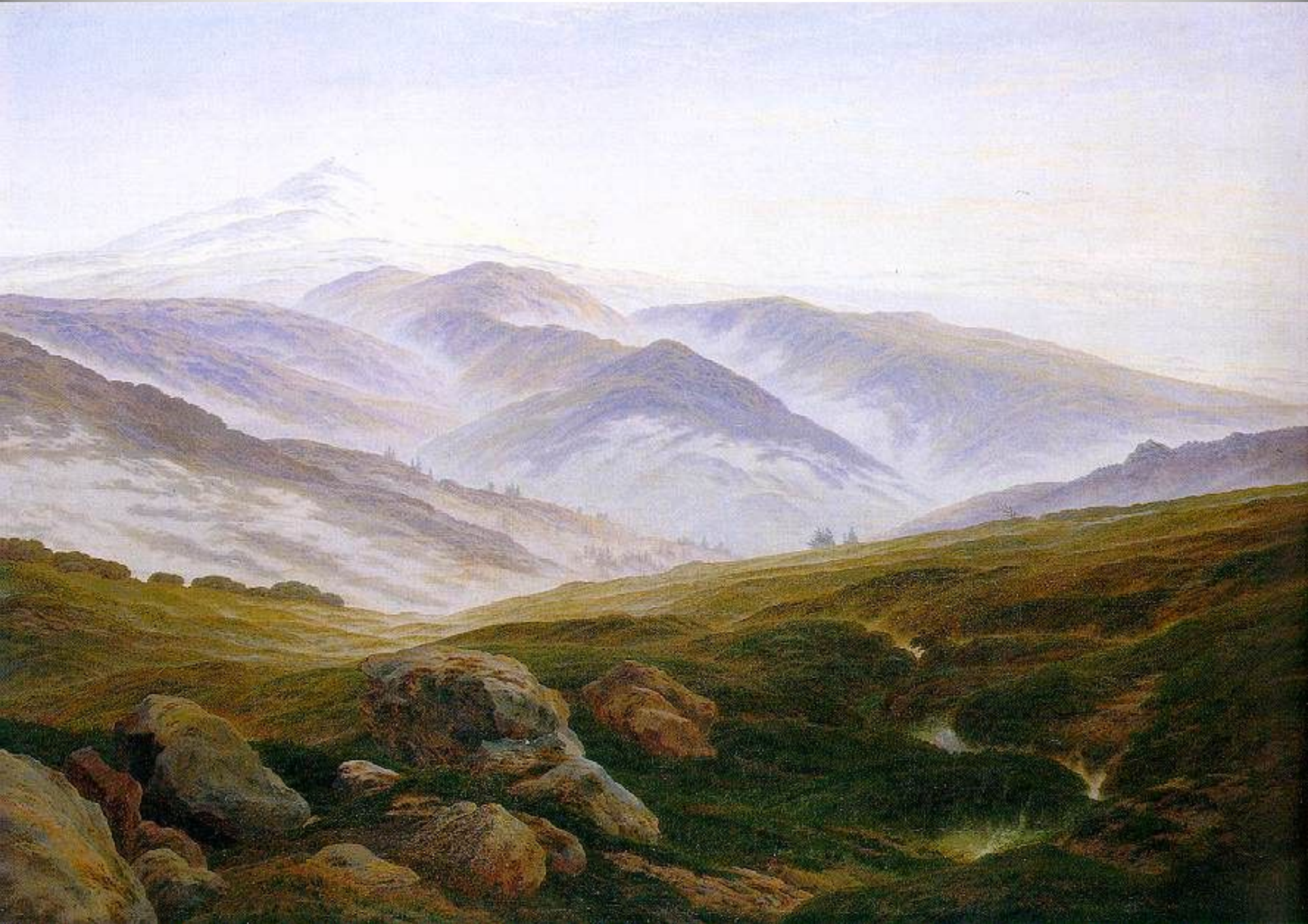
Friedrich, Caspar David 1774-1840 Riesengebirge 1835 Oil on canvas 73.5 x 102.5 cm. Hermitage, St. Petersburg תיאור ההרים מדגיש את לא רק את ההנאה שביופיים, אלא בודק עד כמה ההתבוננות בטבע מרוממת את הנפש.