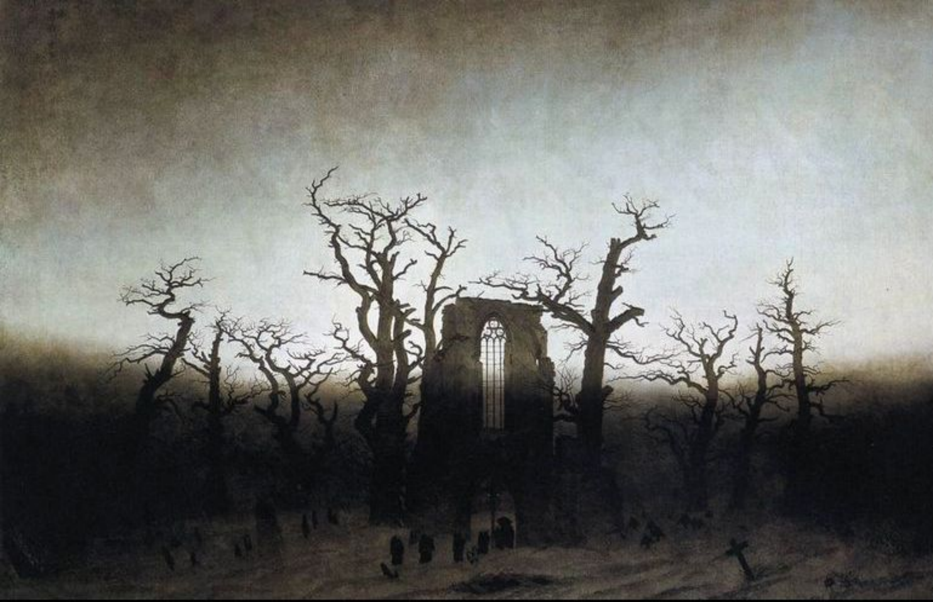
The Abbey in the Oakwood 1809_10